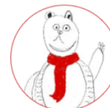
Михаил Сундукович талисман и просто хороший медведь