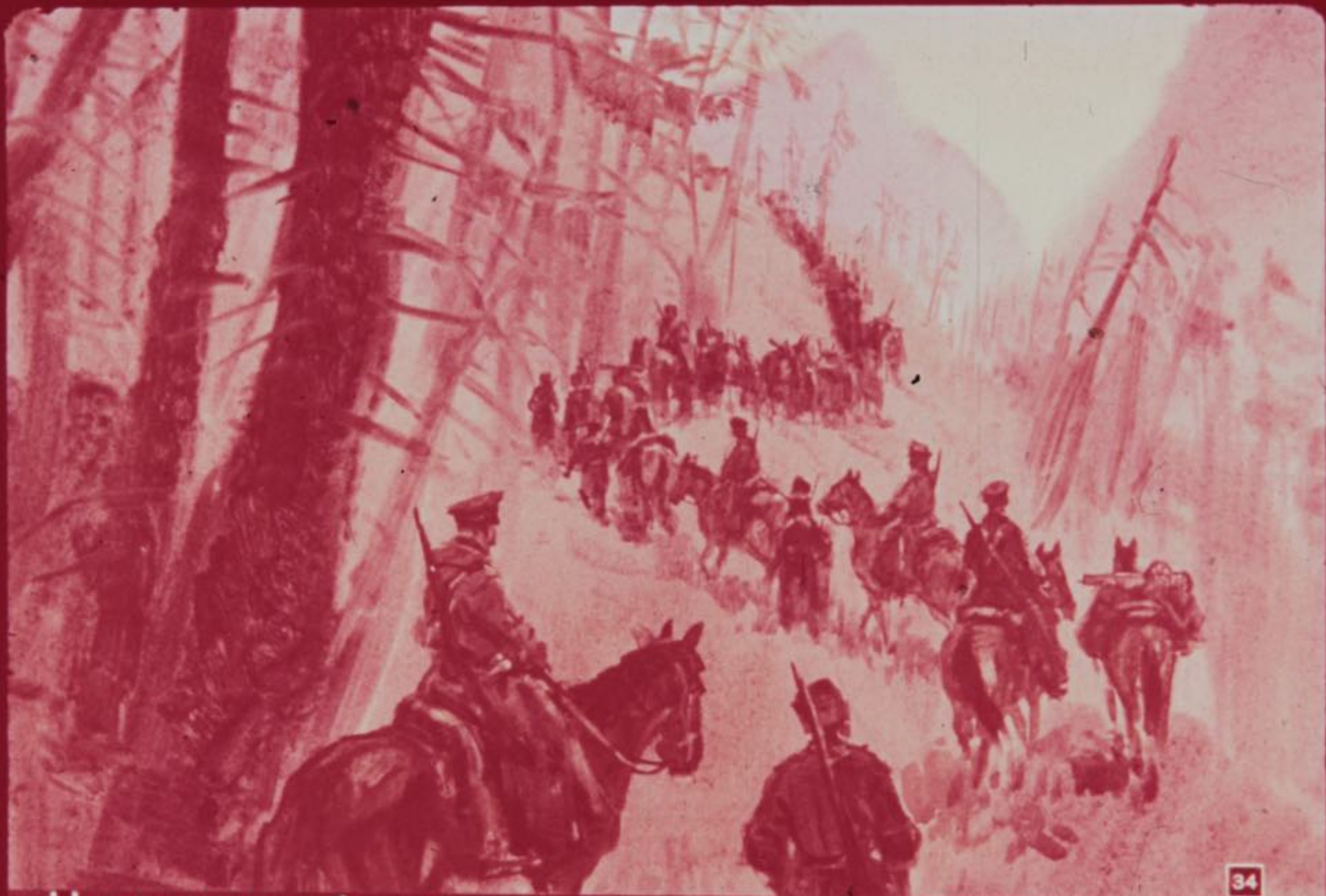
На рассвете белый полк двинулся в горы той же тропой, на- кой вчера спустился вниз Павликов отряд.