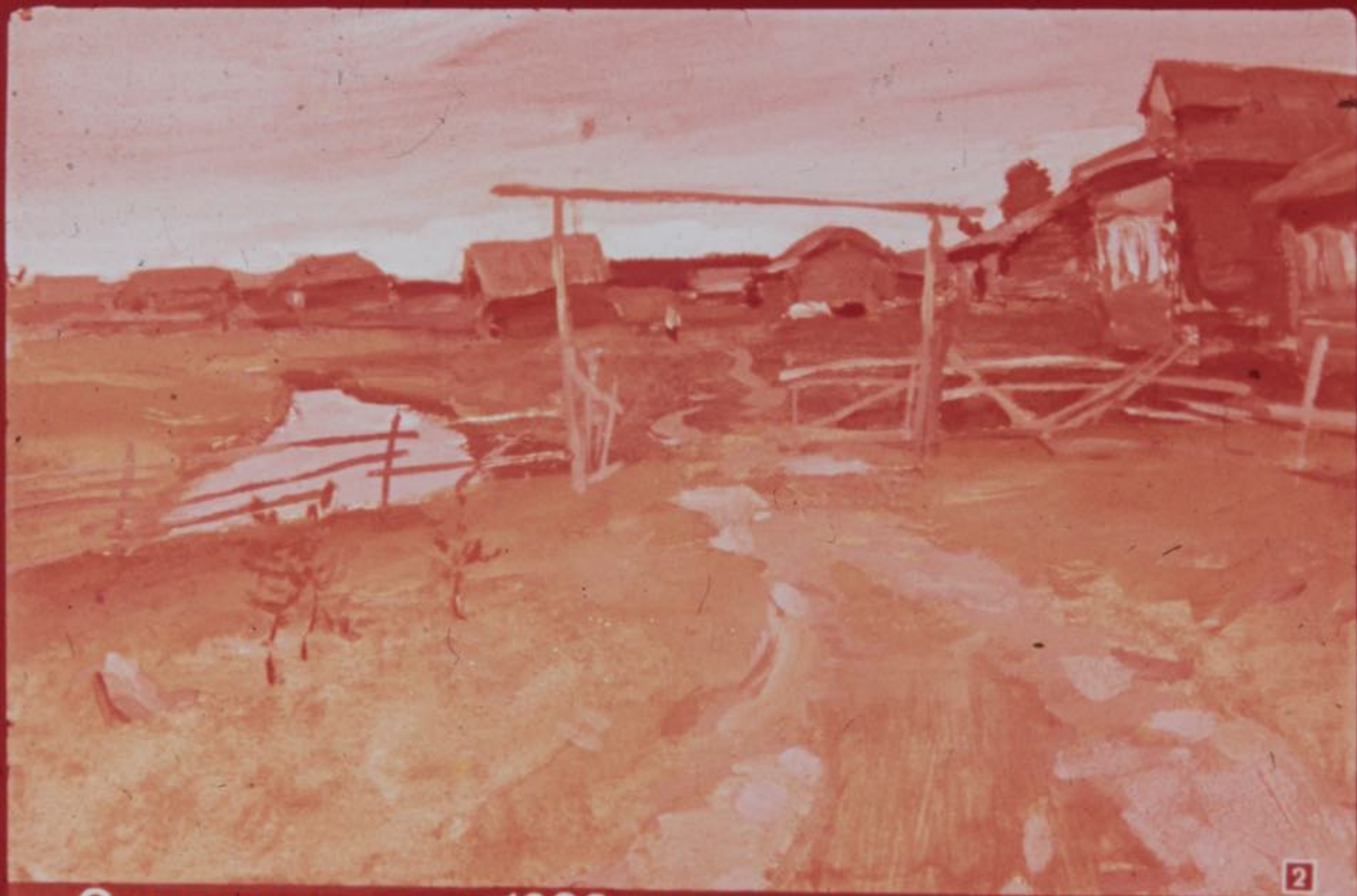
2 Это случилось в 1932 году в маленькой деревне Герасимовке на севере Урала.