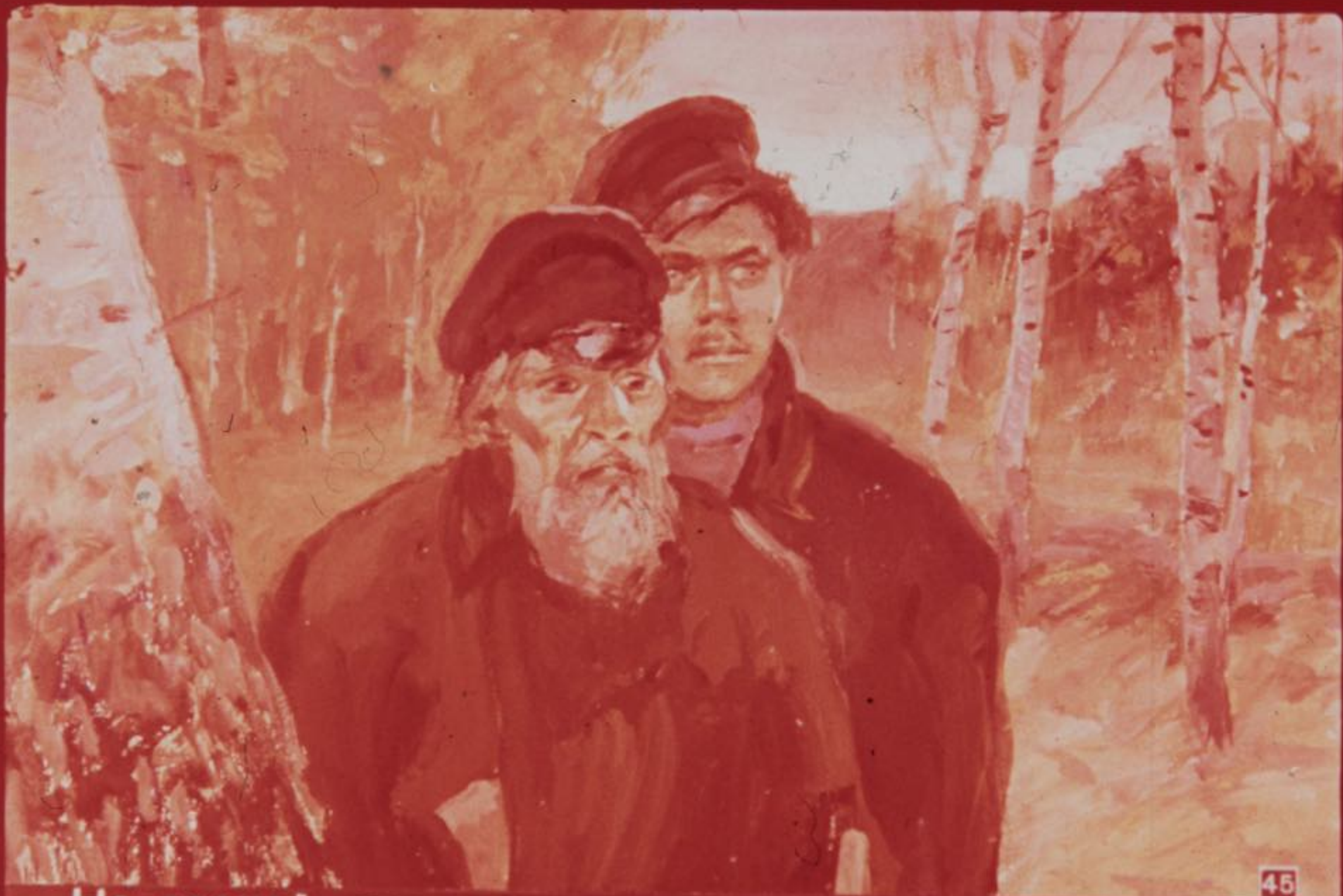
На лесной полянке они подстерегли возвращающихся с ягодами мальчиков.