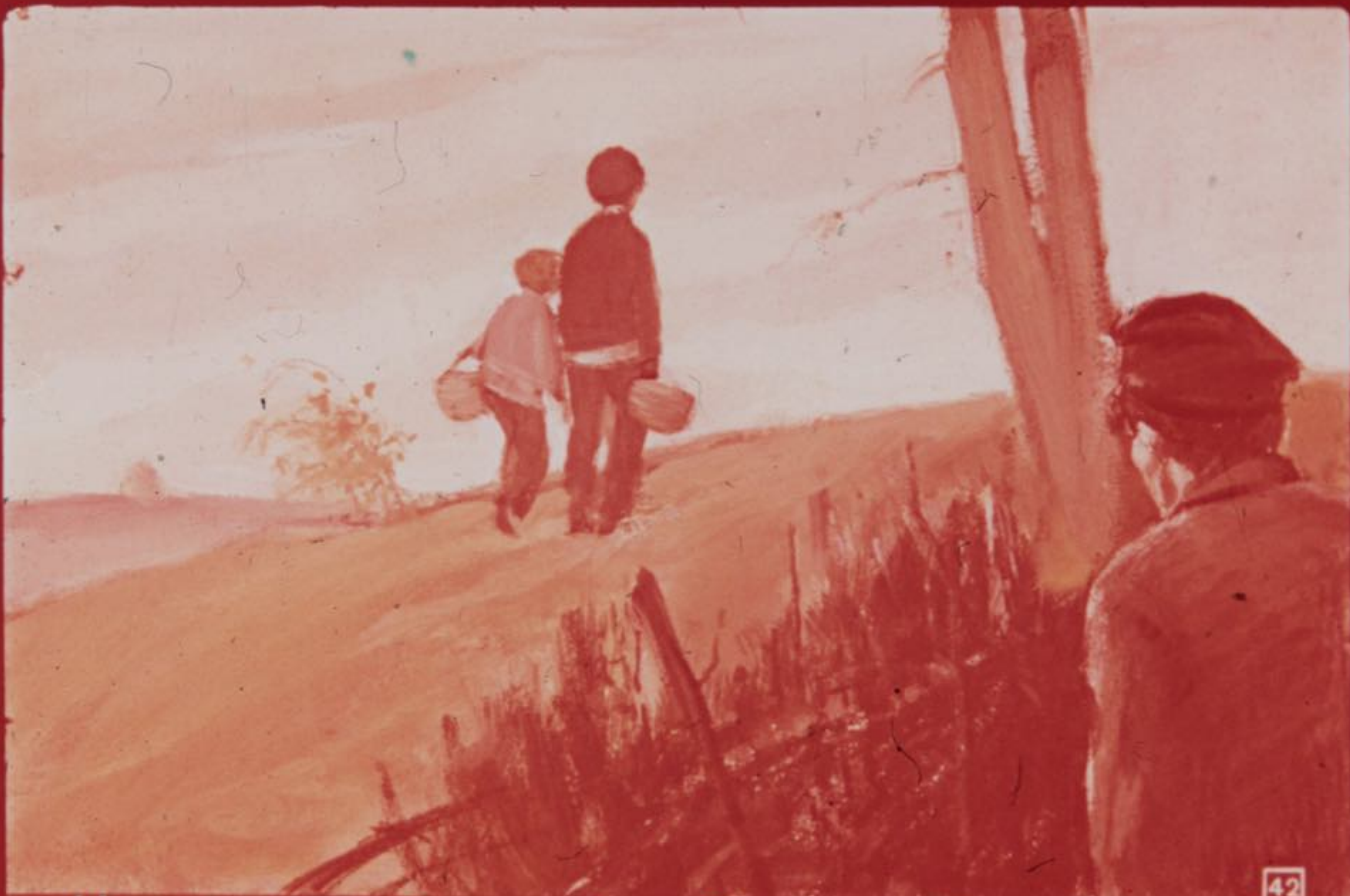
На рассвете 3 сентября Павлик и Федя отправились по ягоды. Данила выследил мальчишков.