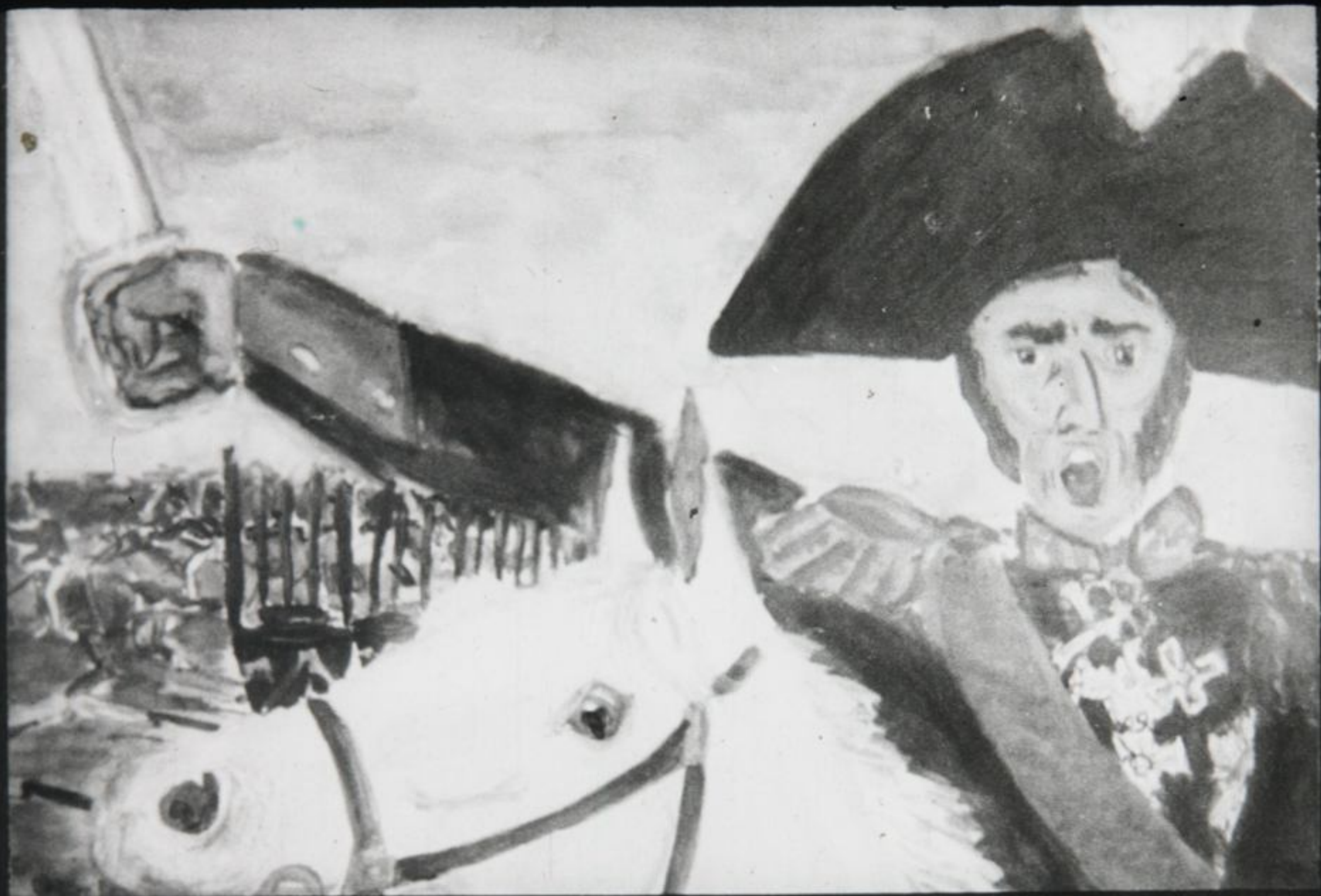
«Бородино». Выхватив саблю, рвётся в атаку неистовый генерал Багратион.