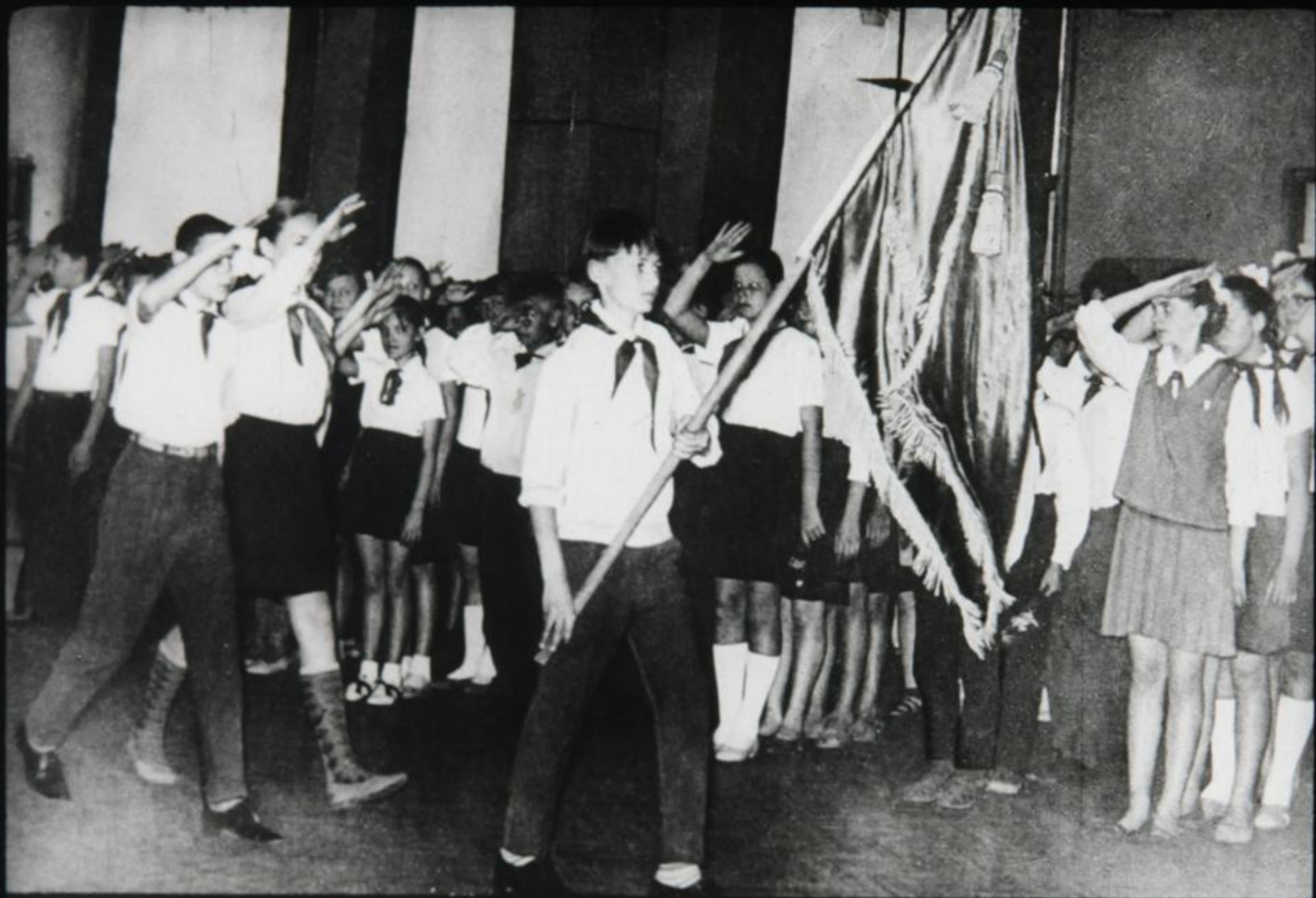
Выставка открыта. Торжественно вносят знамя.