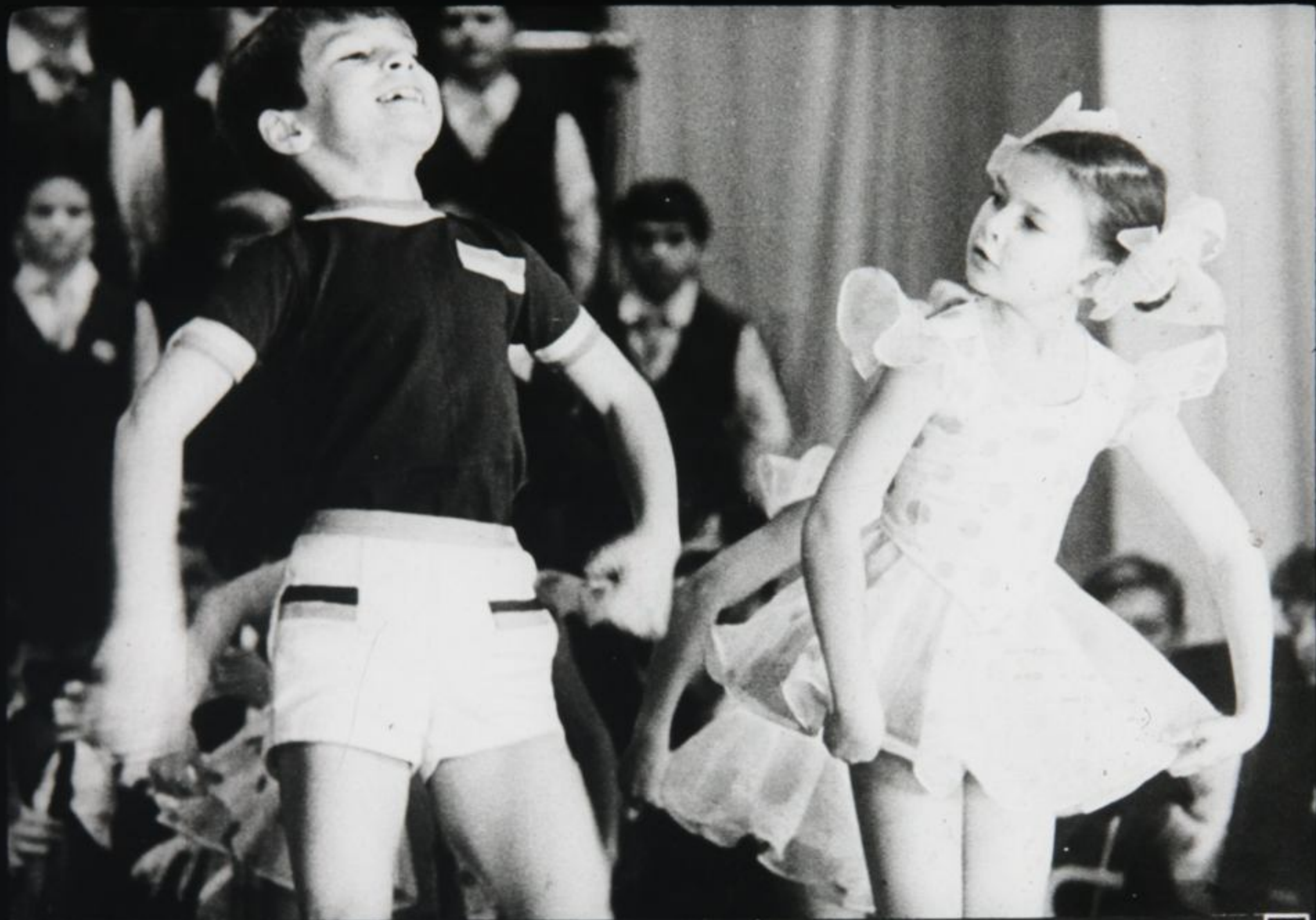
Здесь репетируют танцоры.