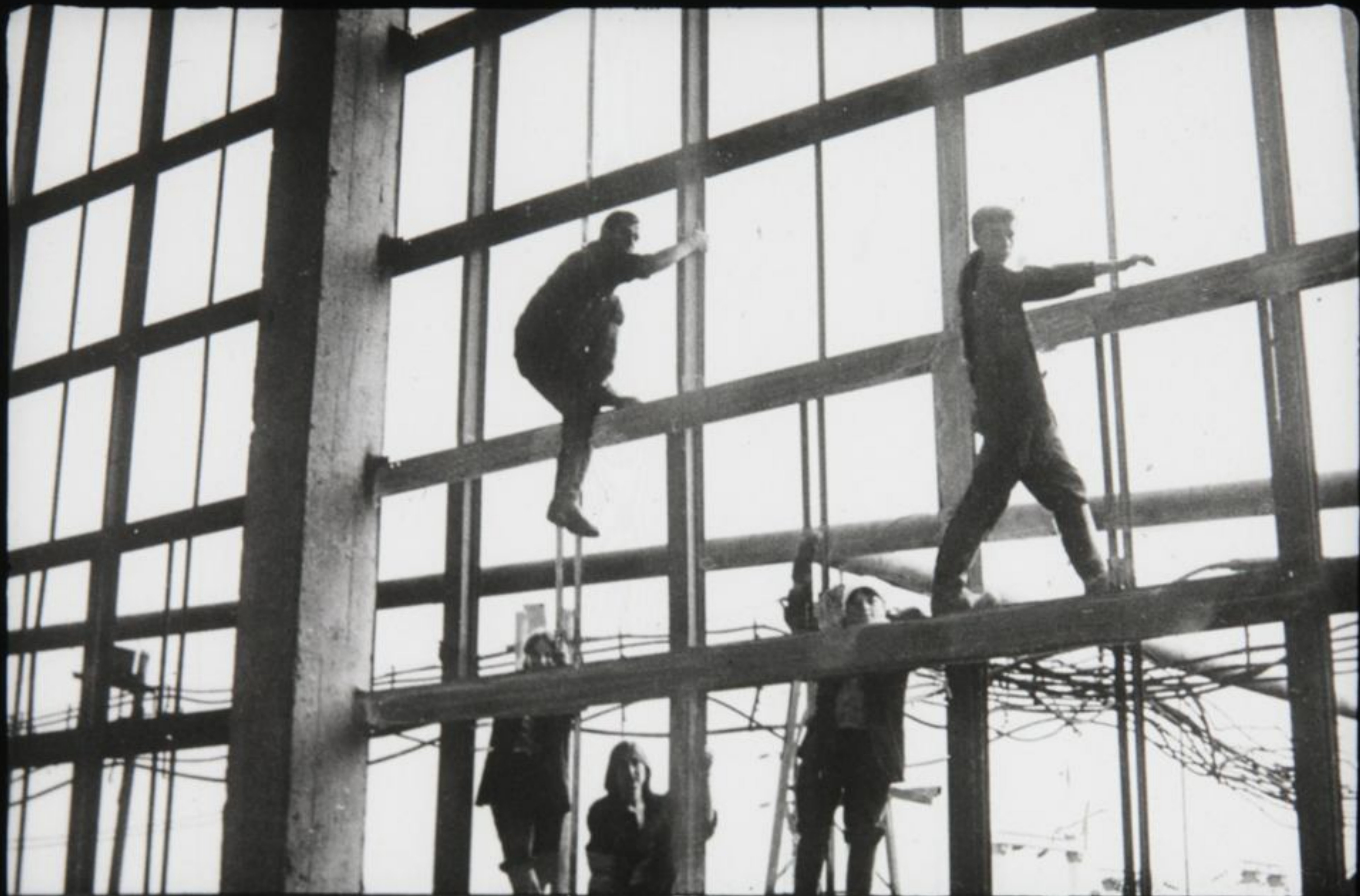
на ударной комсомольской стройке