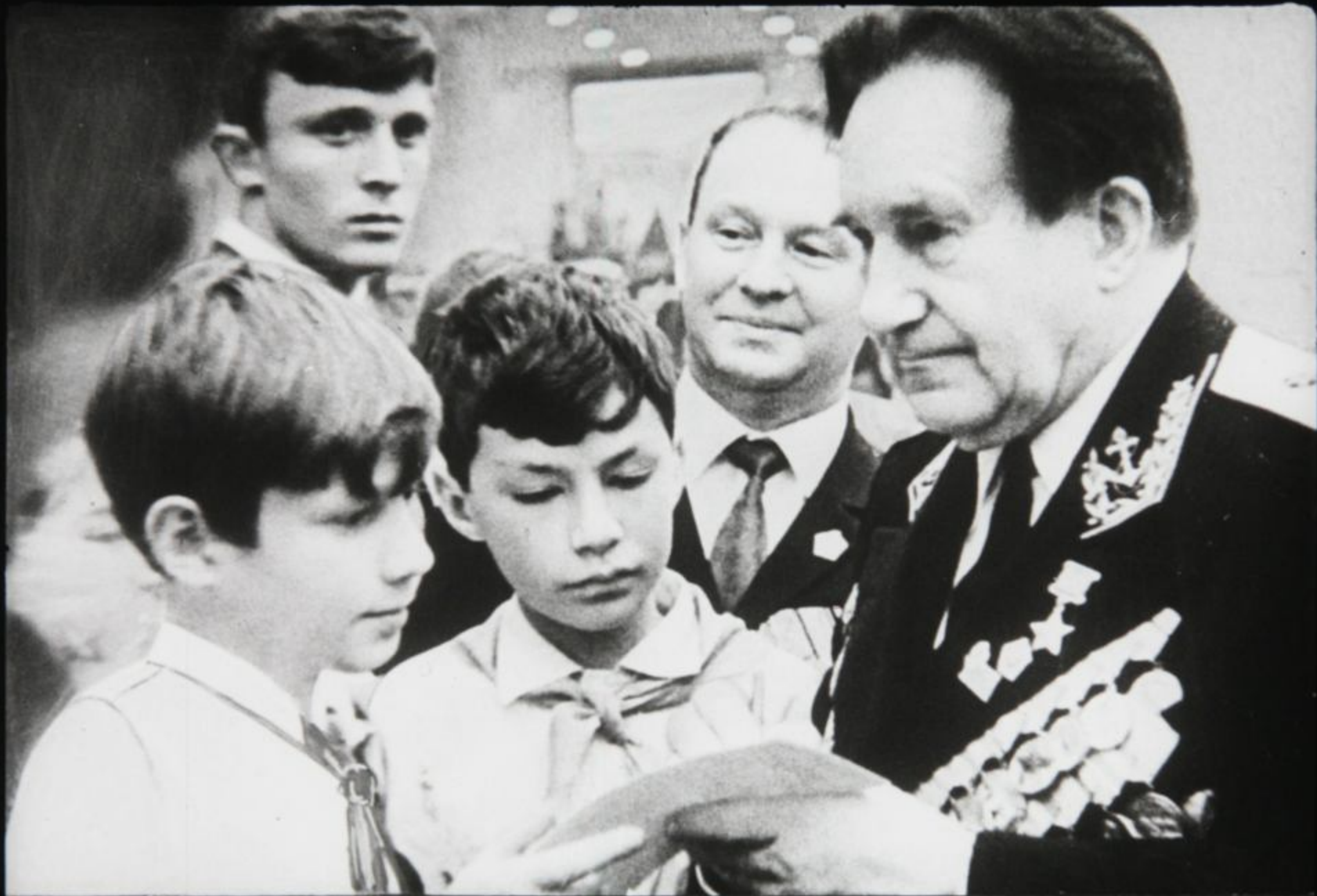
ветеранов Великой Отечественной войны,