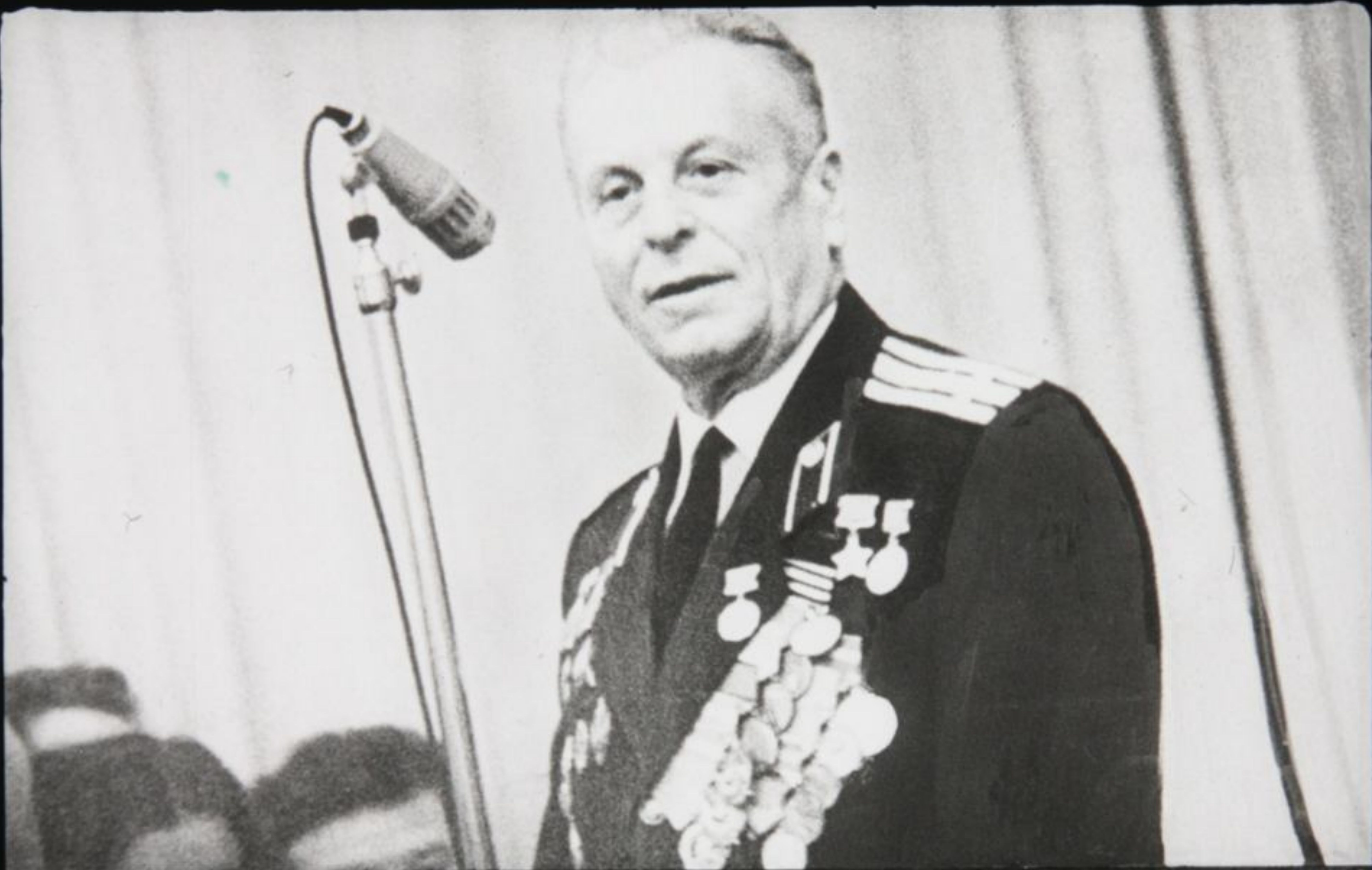
как легендарный пограничник Никита Карацупа.