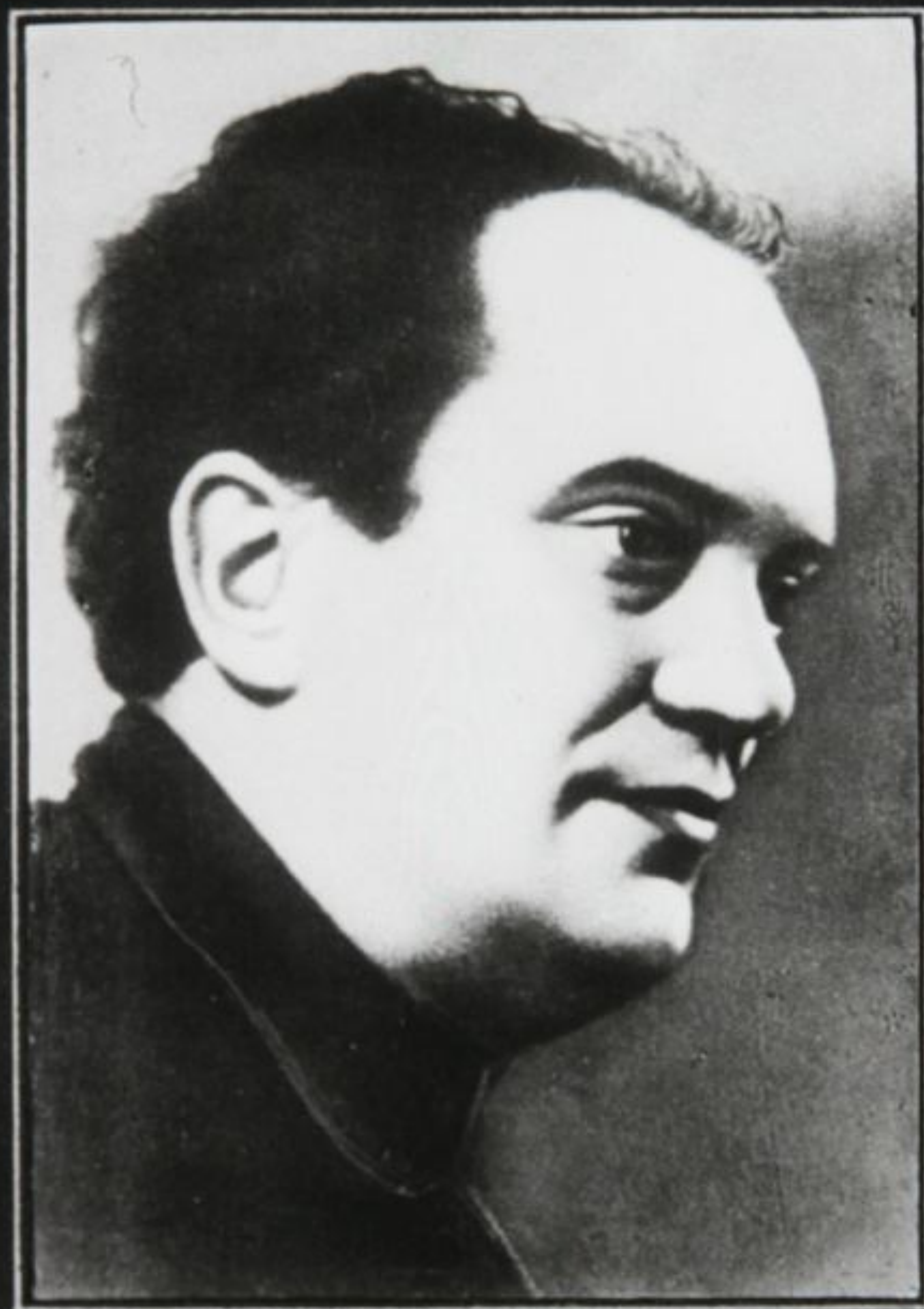
Валериан Владимирович Куйбышев. 13