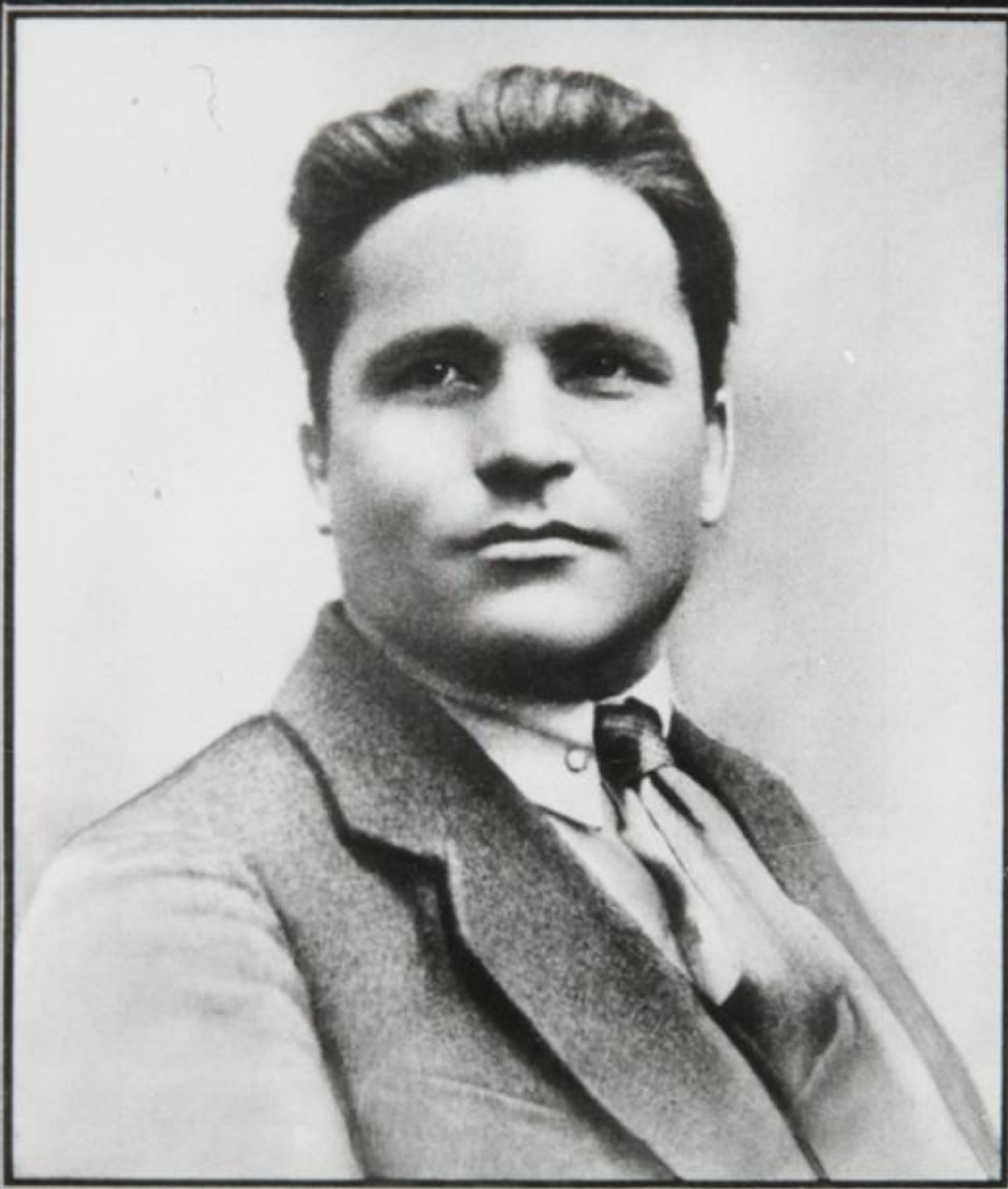
Сергей Миронович Киров,