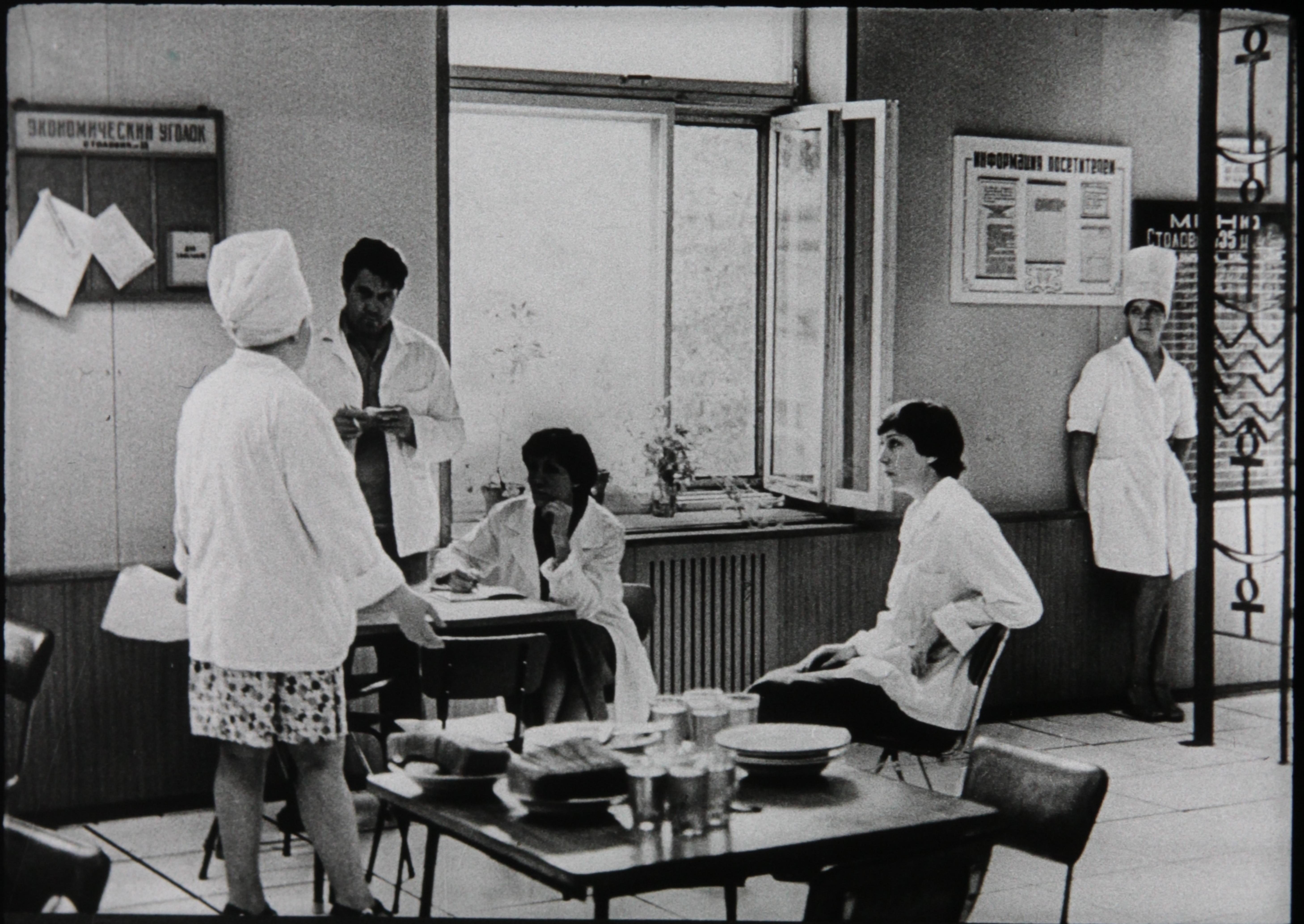
обследование закрепленных за ней столовых, чайных.