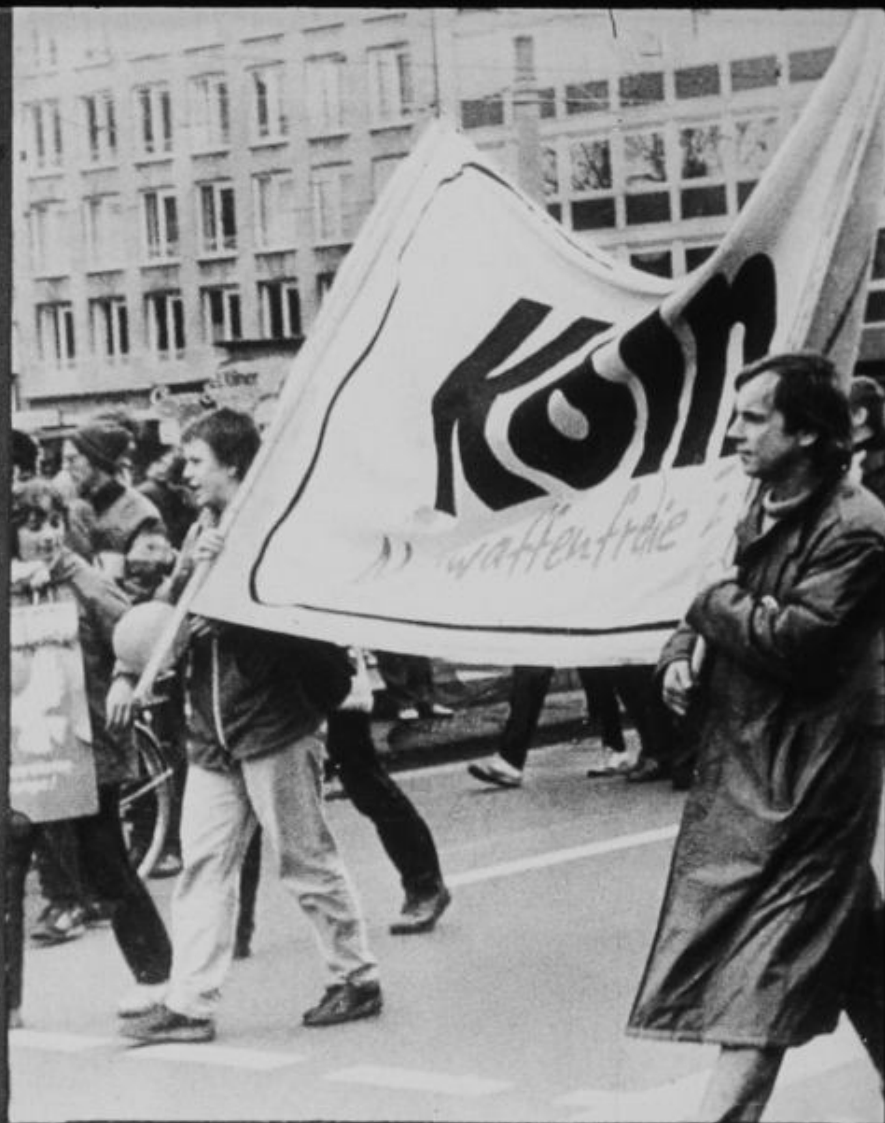
Антивоенные демонстрации молодежи в Лондоне и Кёльне.