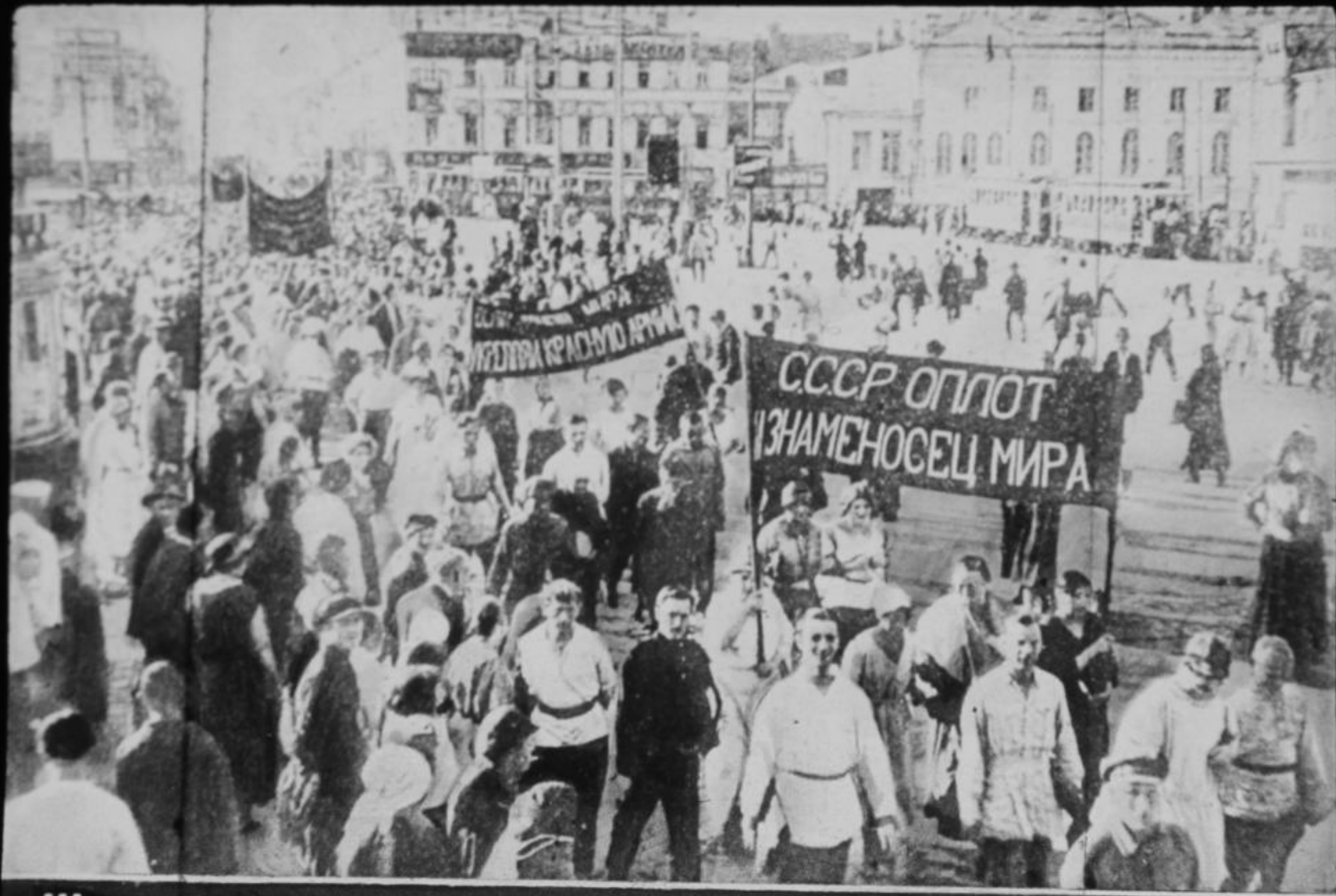
Широкое антивоенное движение молодежи заполнилось в 30-е годы.