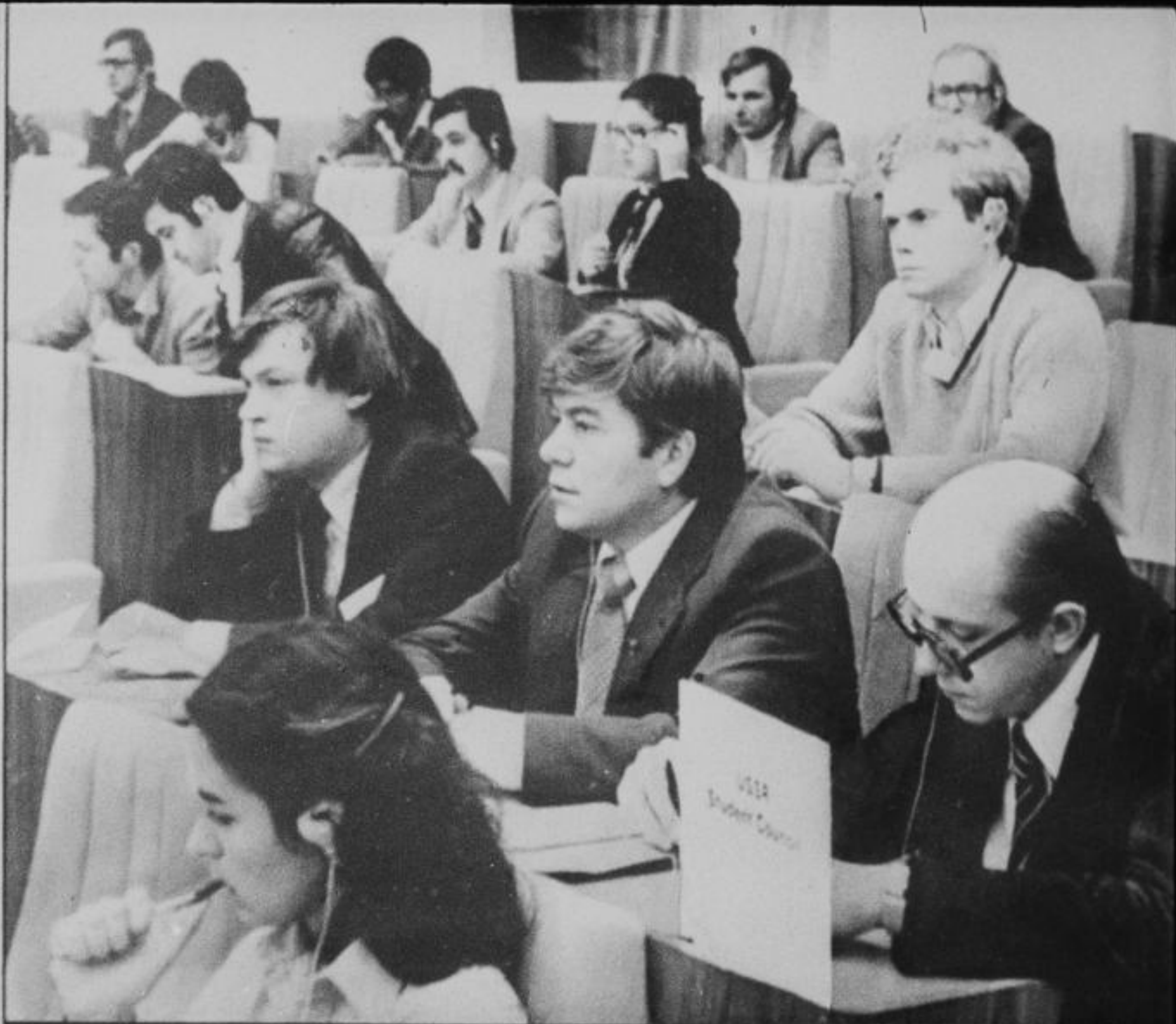
XIII конгресс Международного союза студентов. Берлин, 1980 год.

ВФДМ и МСС накопили богатый опыт мобилиза- ции молодежи на борьбу за мир.