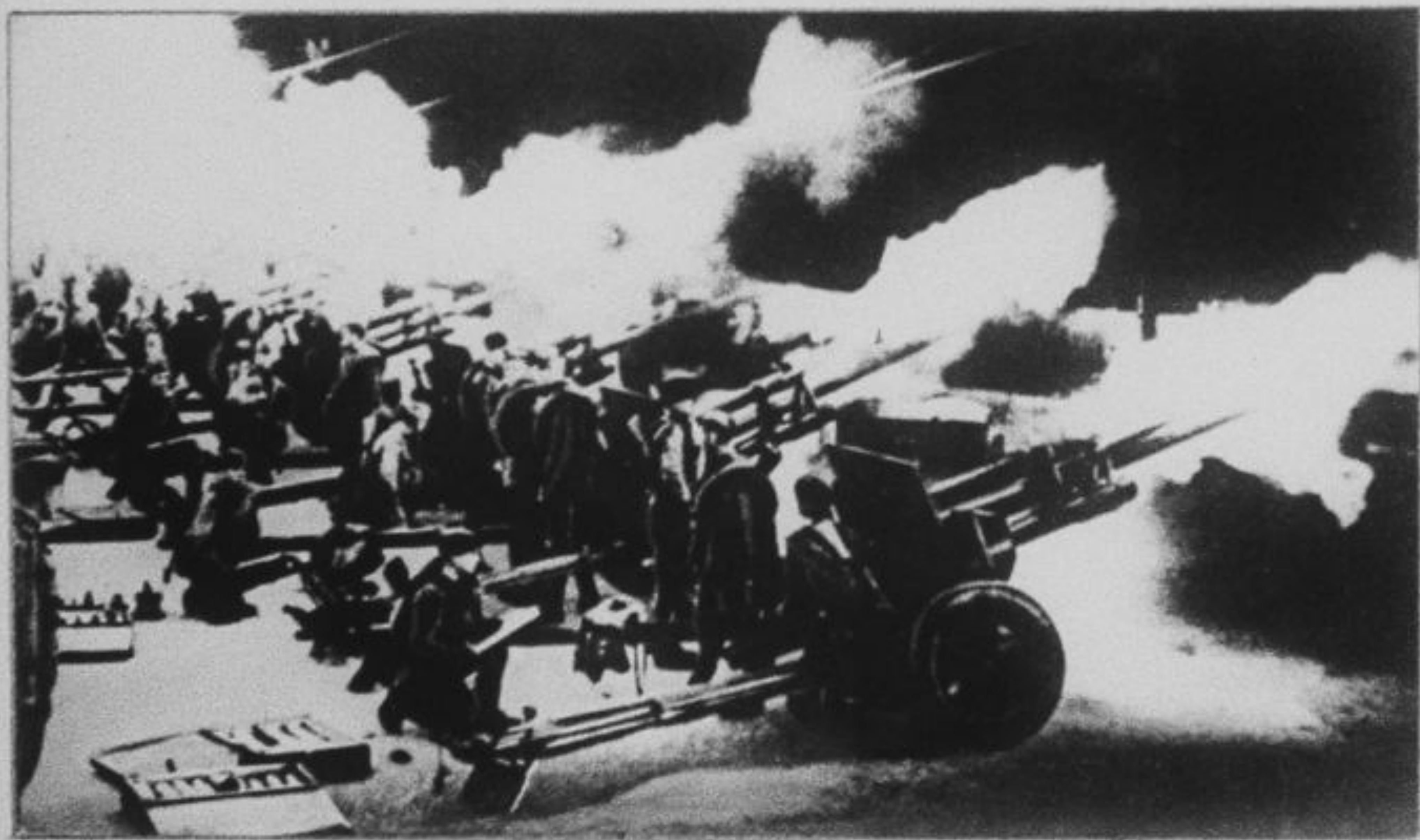
Москва, 5 августа 1943 года.