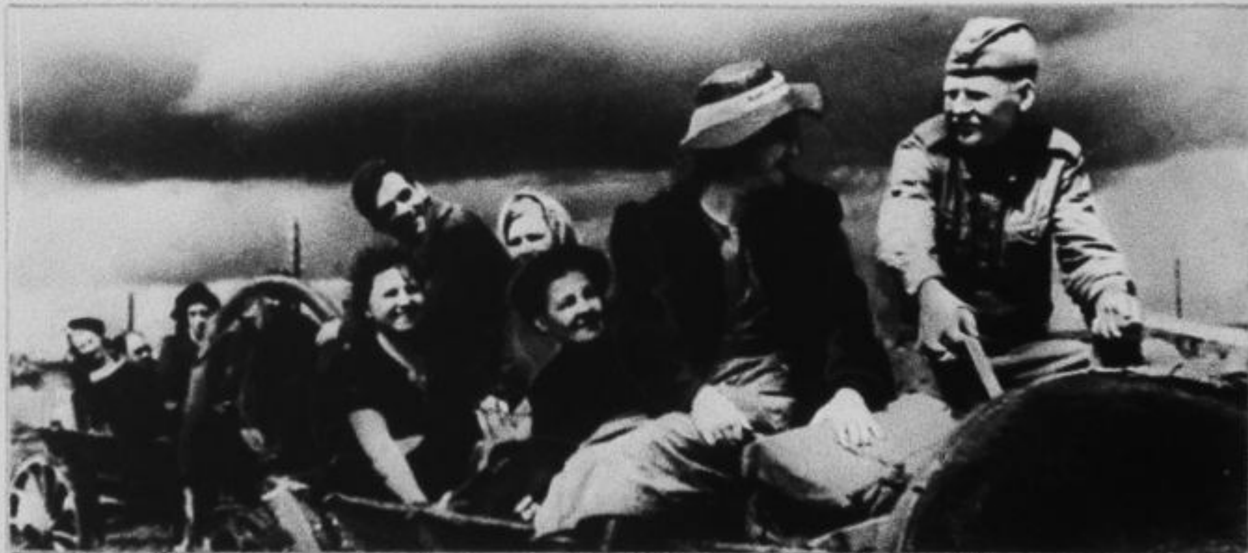
С концертом на фронт.