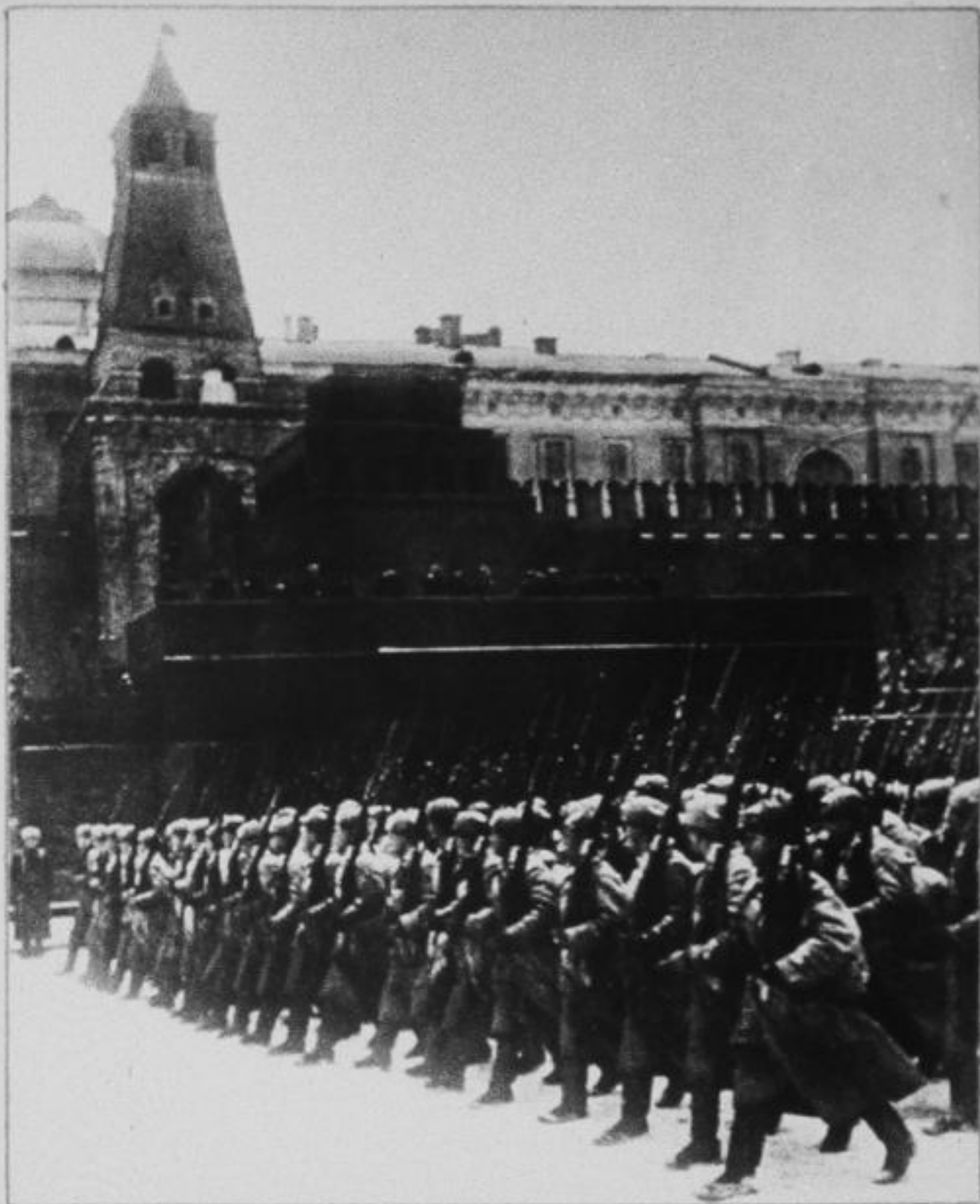
Парад 7 ноября 1941 года. Москва, Красная площадь.