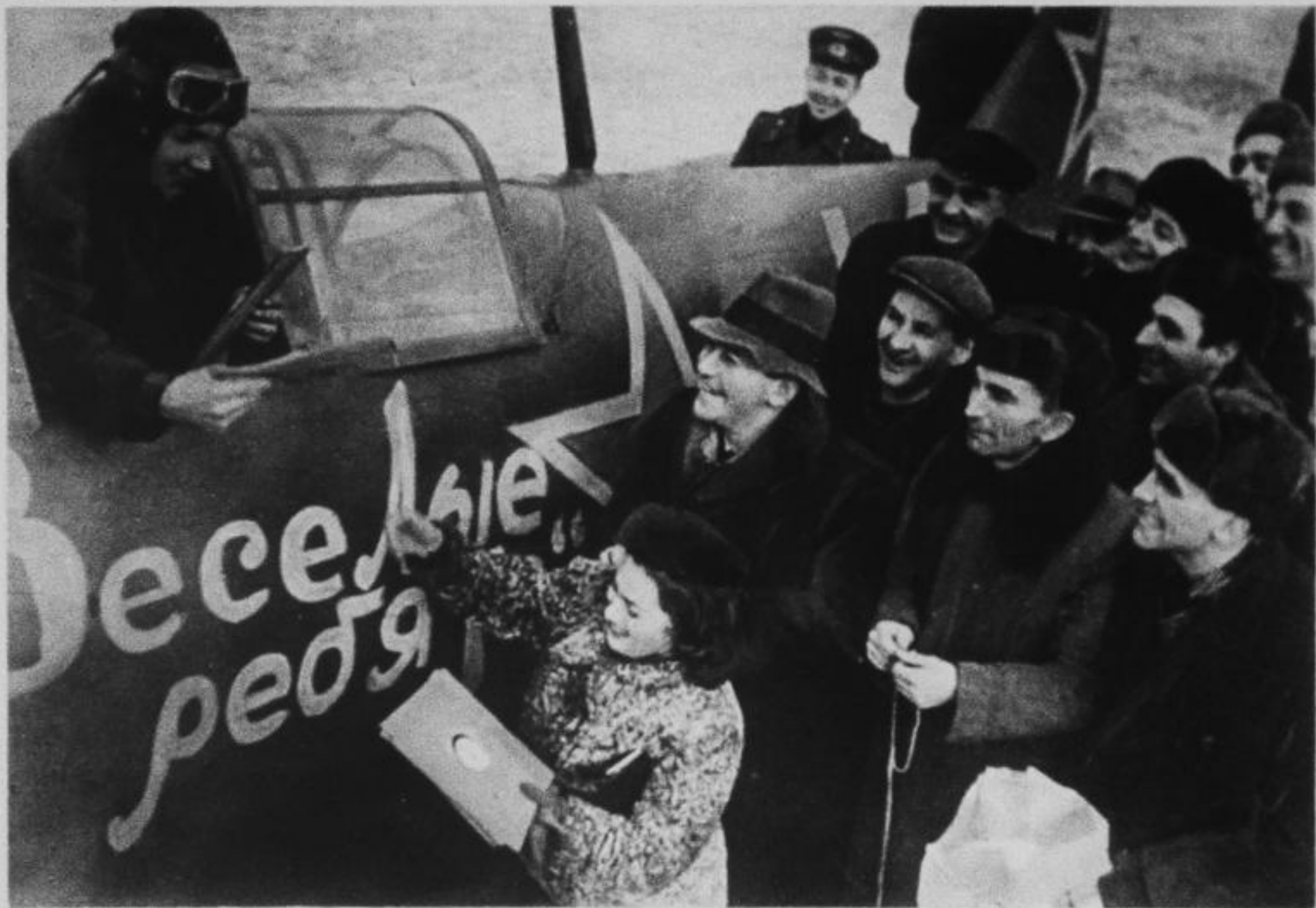
Заслуженный артист РСФСР Л. О. Утесов и музыканты джаз-оркестра передают построенные на их средства самолеты «Веселые ребята» летчикам 5-го гвардейского авиационного полка.