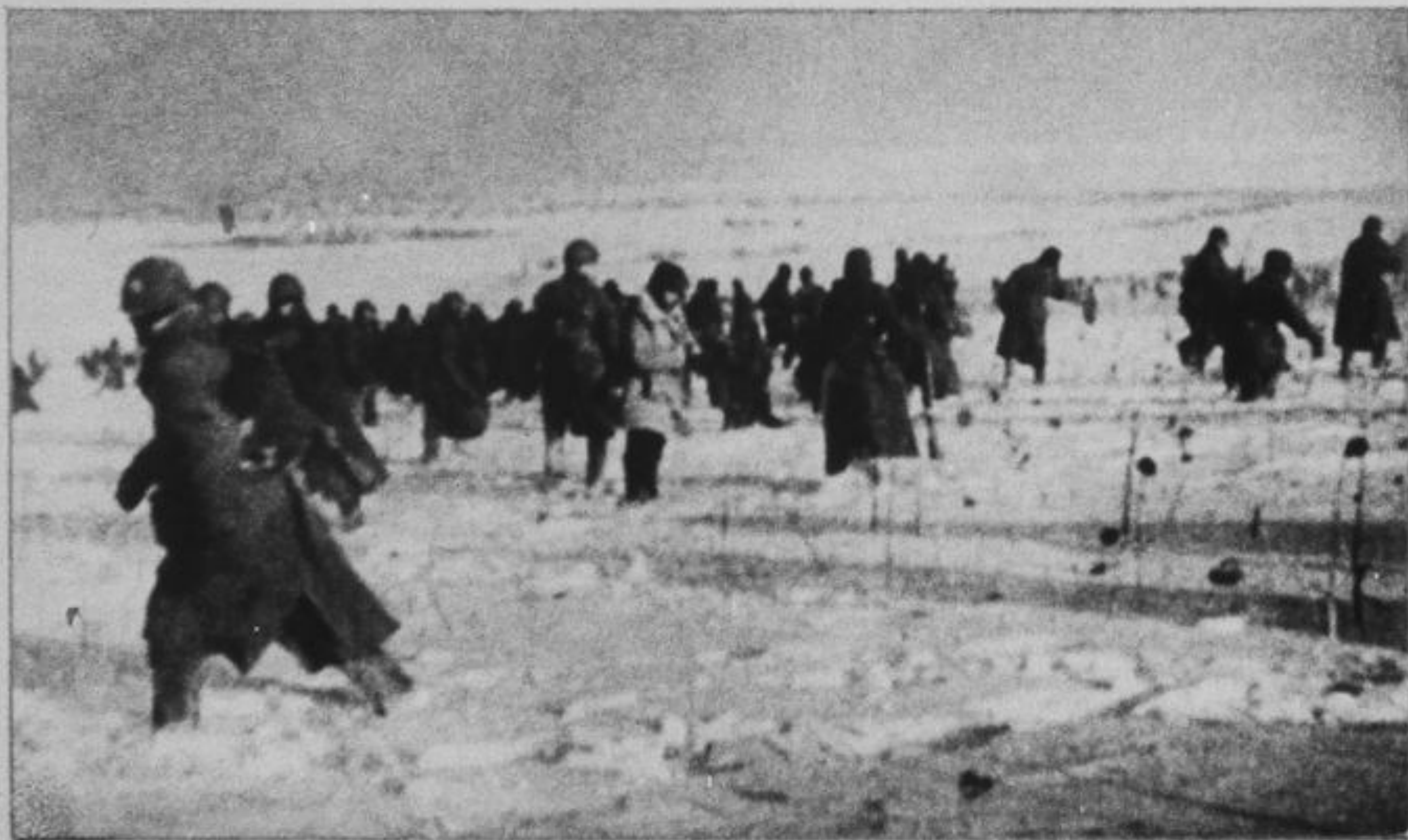
Встреча воинов Донского и Сталинград- ского фронтов 26 января 1943 года.

Из воспоминаний Маршала Советского Союза В. И. Чуйкова