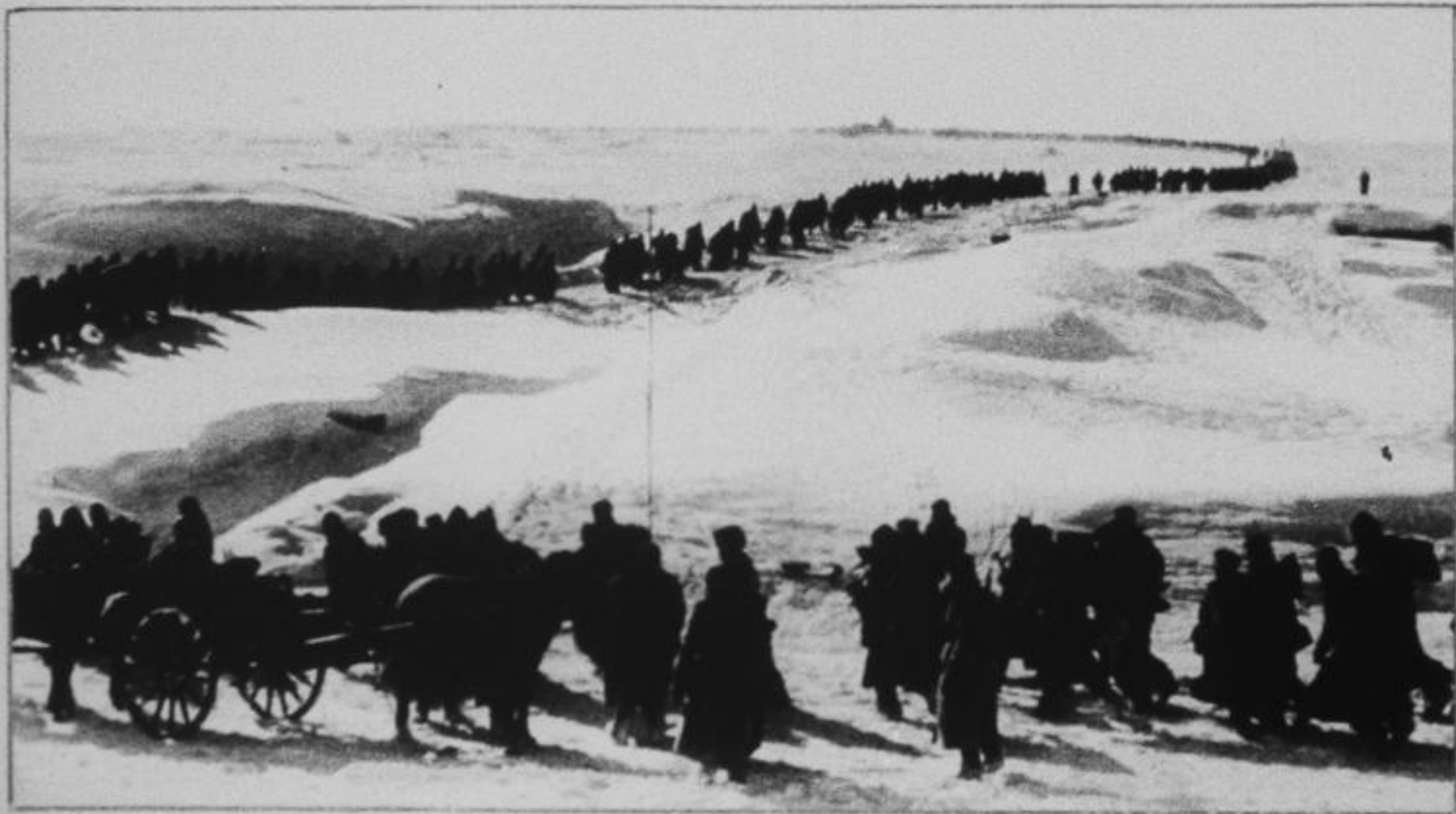
Пленные гитлеровцы под Сталин- градом.

Таков исход одного из самых крупных сражений в истории войн...»