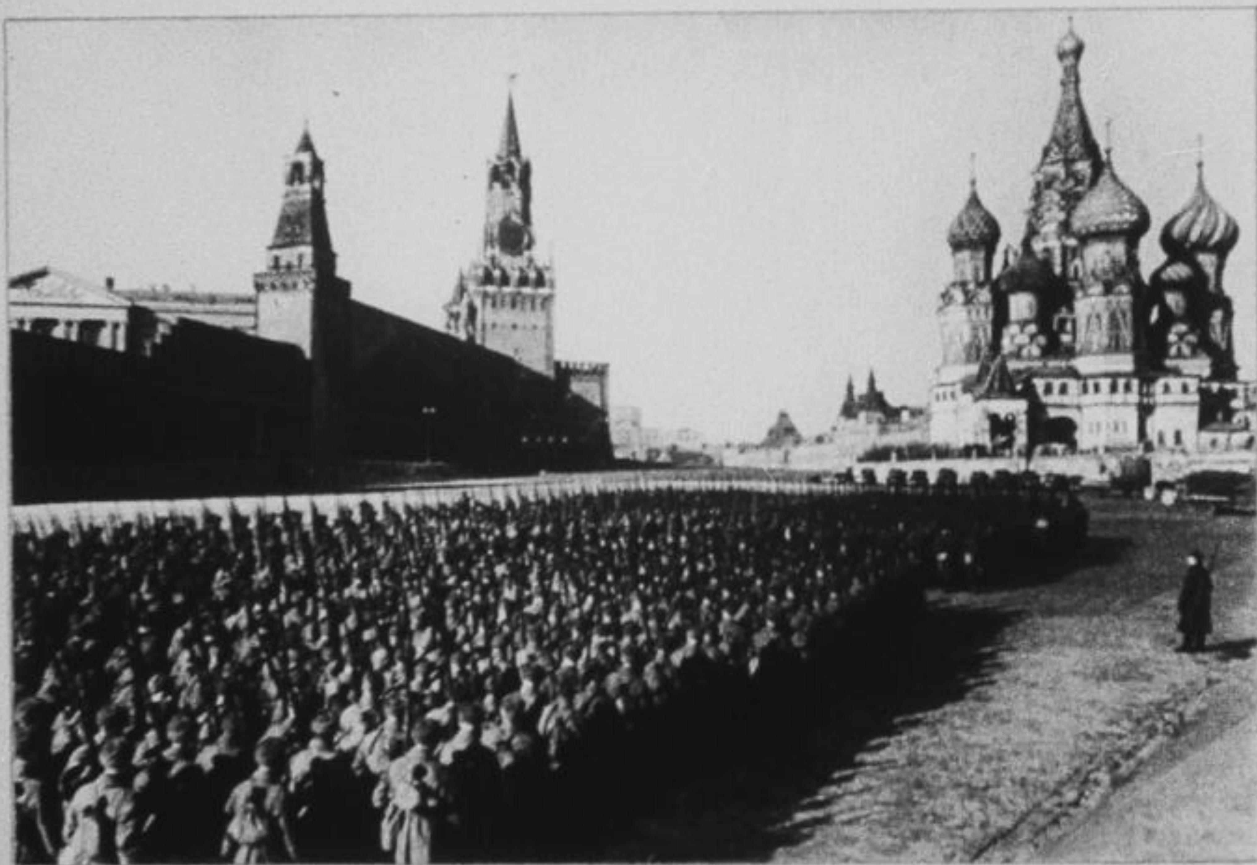
На фронт. Москва, Красная площадь, 1941 год.

Из воспоминаний гвардии лейтенанта Д. Хотнянского