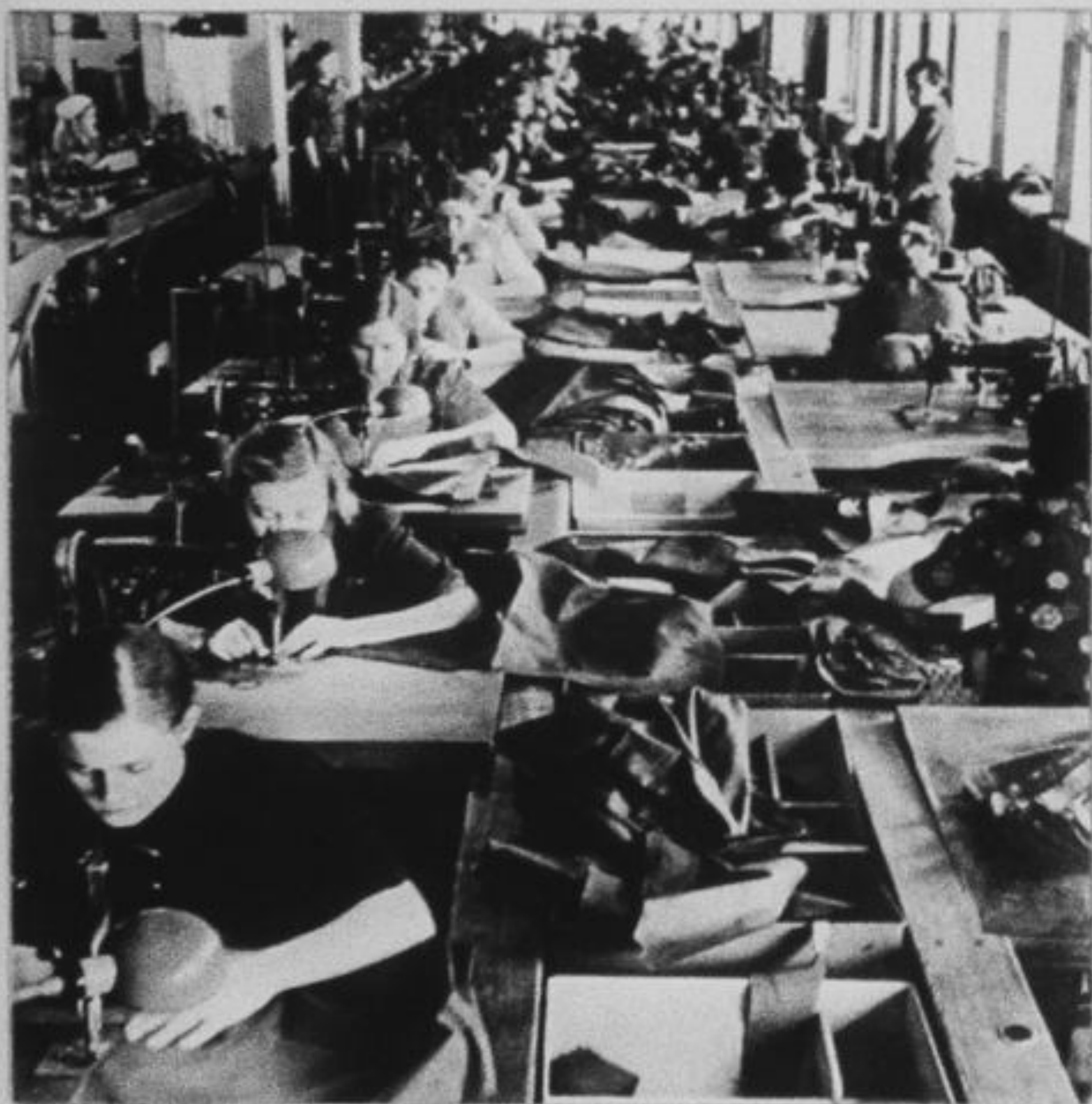
Работницы швейной фабрики шьют обмундирование для воинов Красной Армии. Москва, 1941 год.