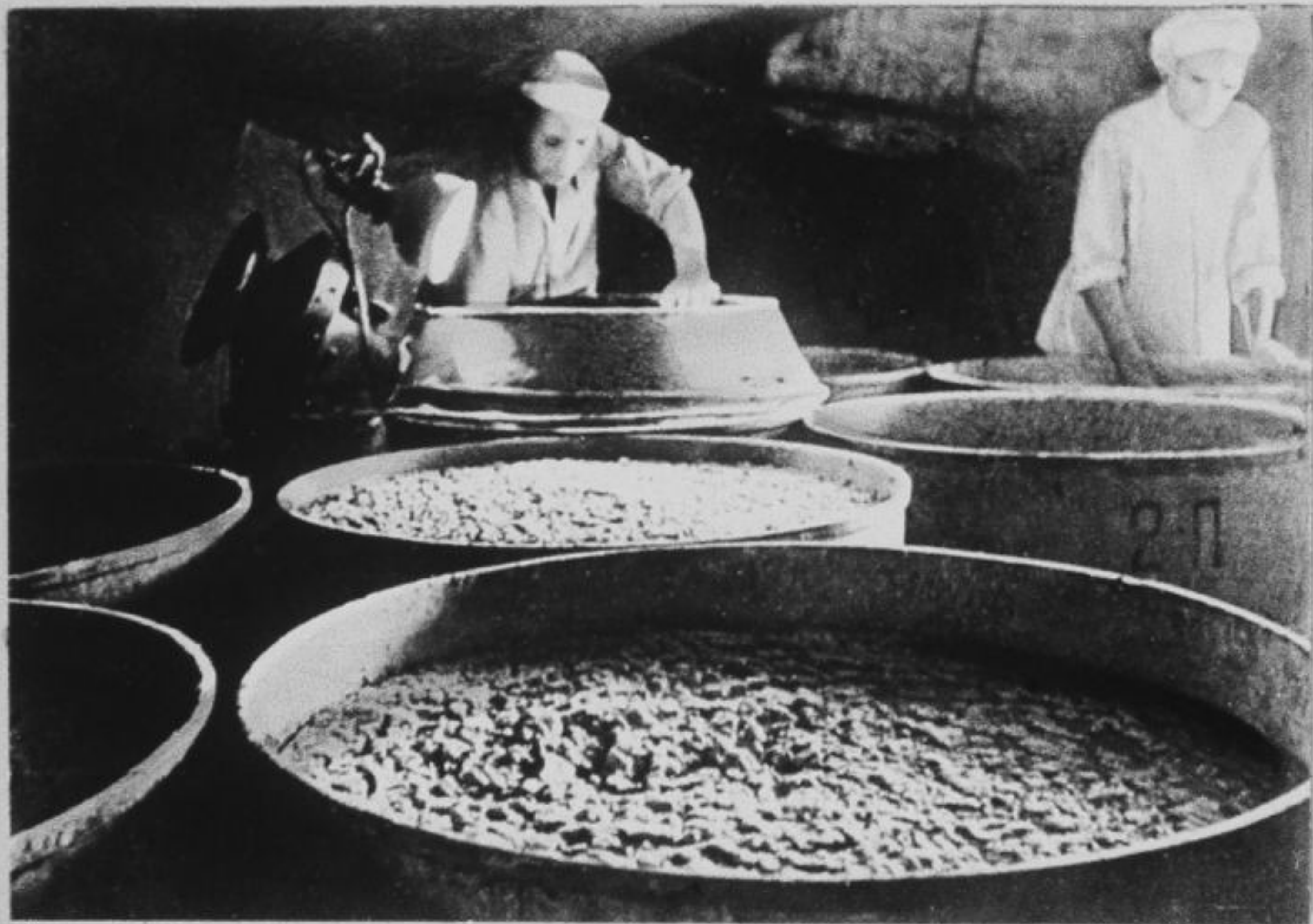
Походный хлебозавод. Западный фронт, 1942 год.

„От того, как накормлен боец, как он одет и обут, как организован его отдых, в значительной степени зависит политико-моральное состояние войск“, — писала «Красная звезда» 30 января 1943 года.