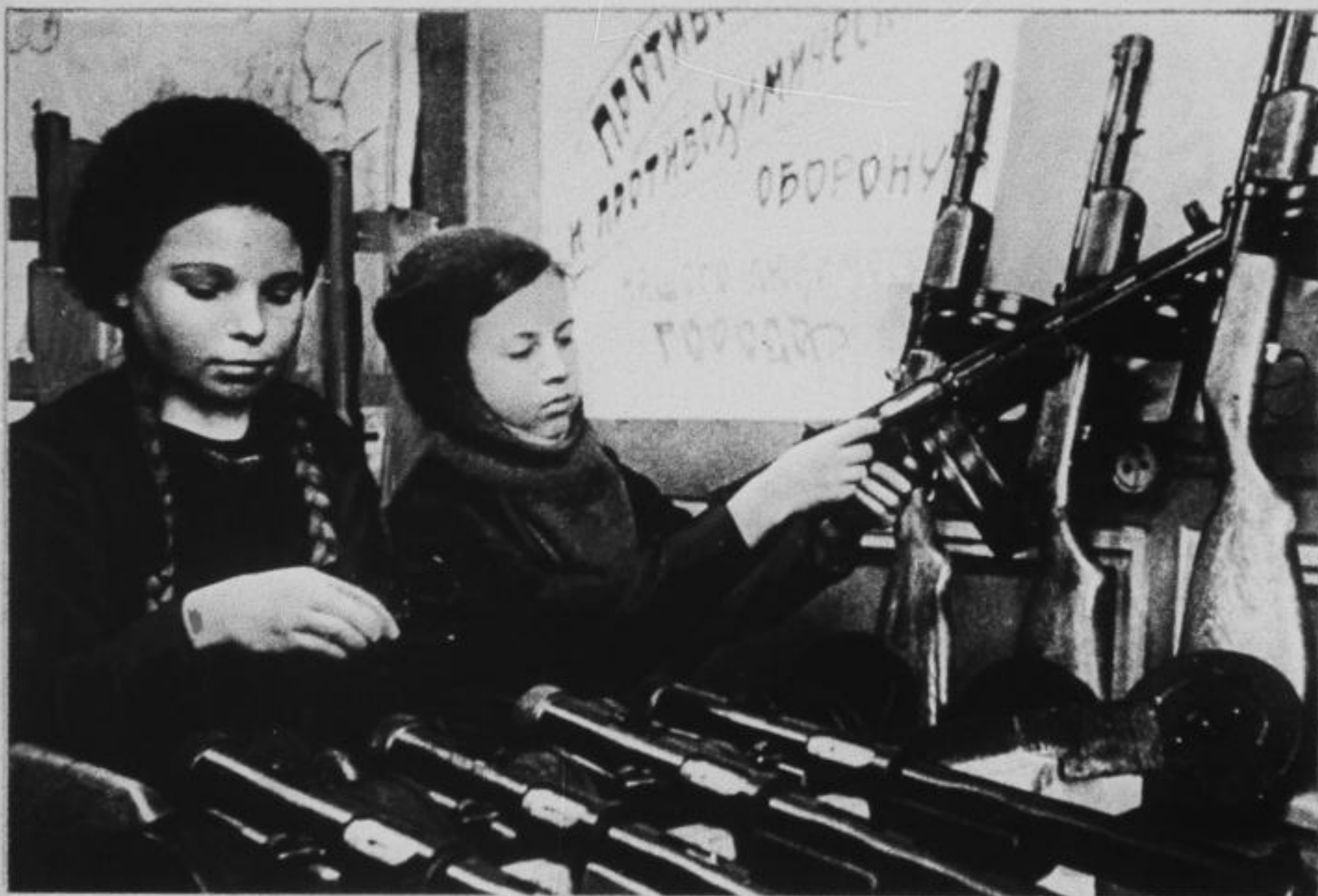
Им вместе— 30 лет. Ленинград, 1942 год.