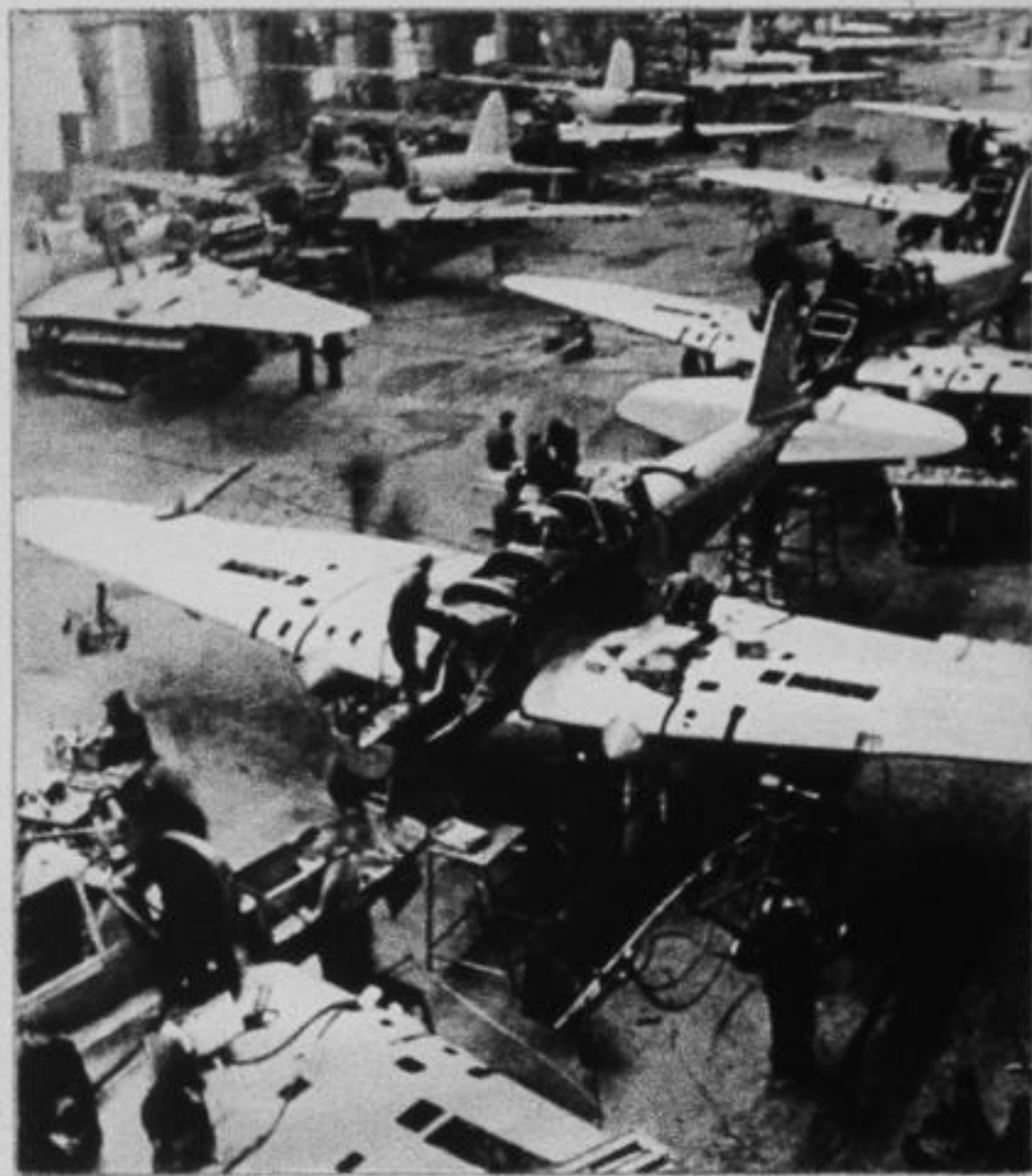
На авиационном заводе. Август 1942 года.