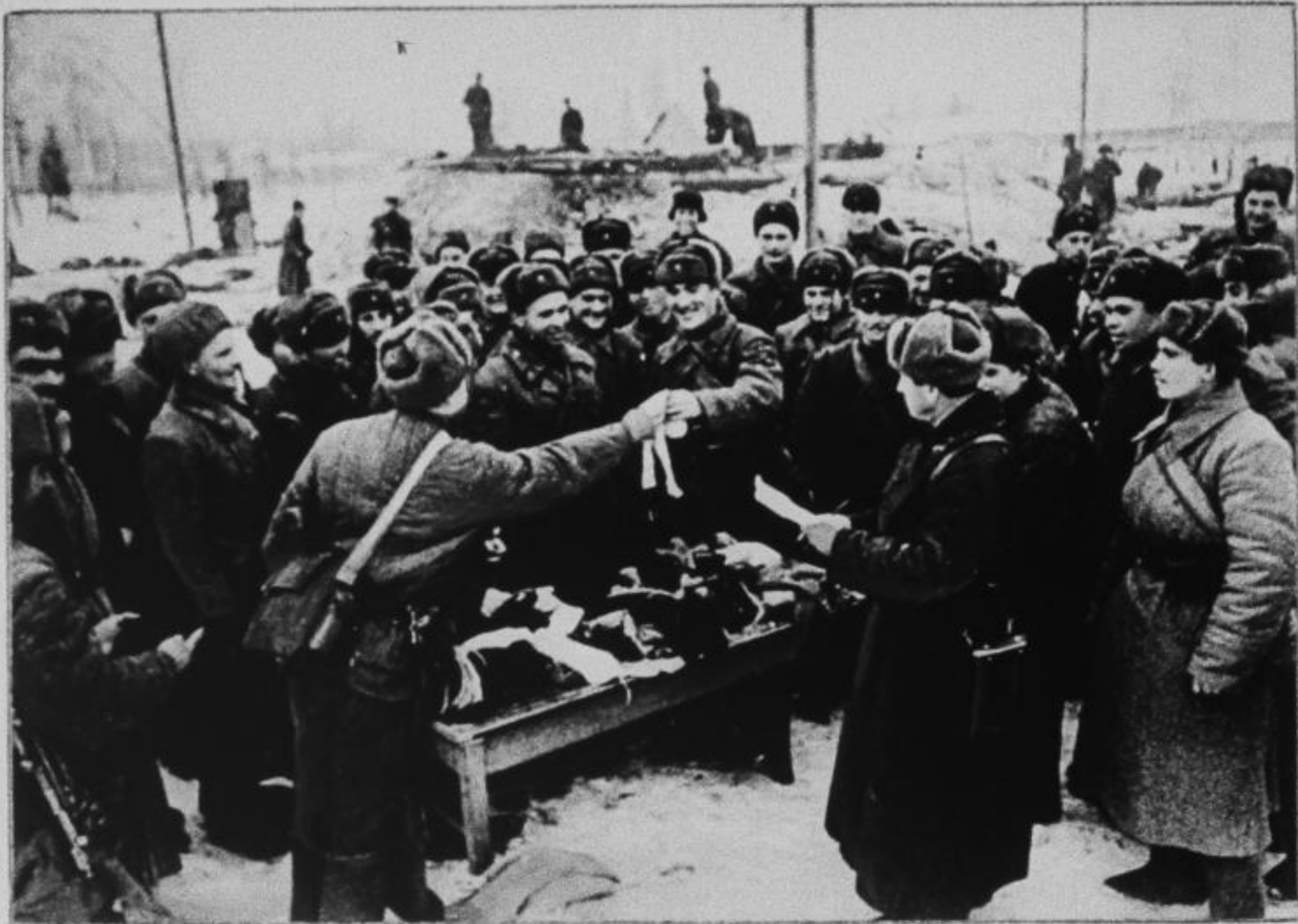
Бойцы действующей армии получают подарки от москвичей. Западный фронт, 1942 год.