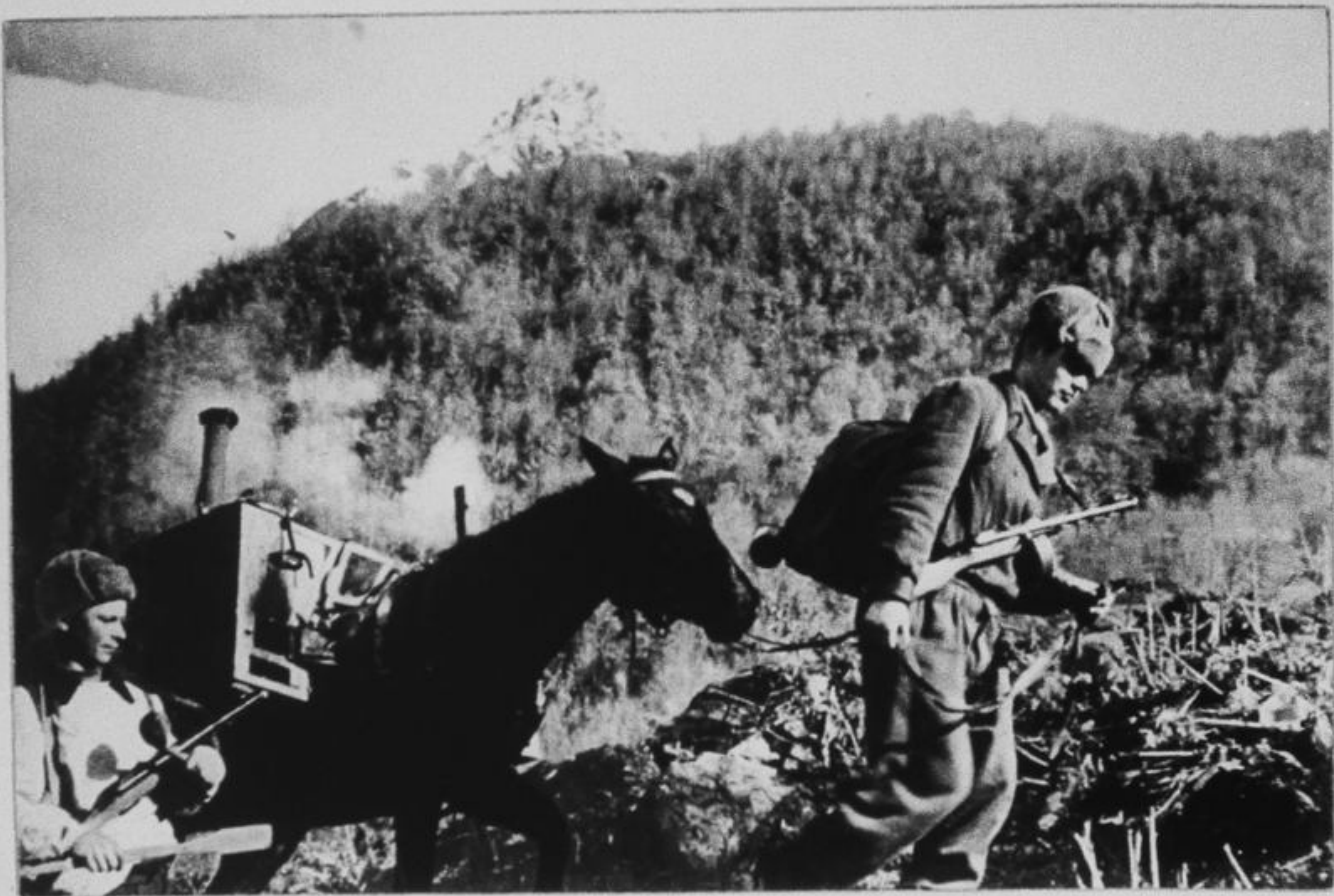
Красноармейская походная кухня. Горные перевалы Северного Кавказа, ноябрь 1942 года.