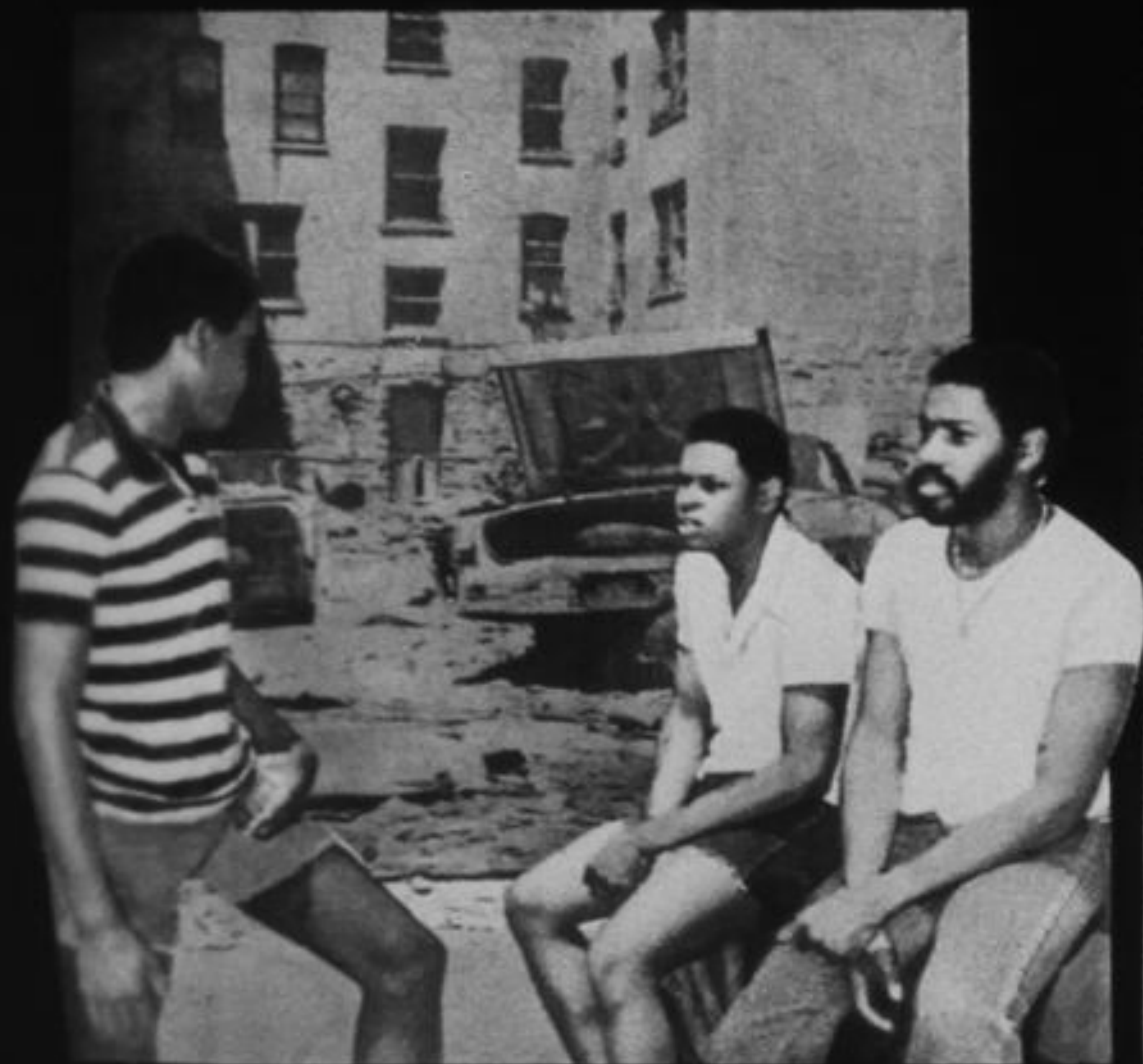
Этим юношам из Бронкса (Нью-Йорк) негде работать и не на что учиться.