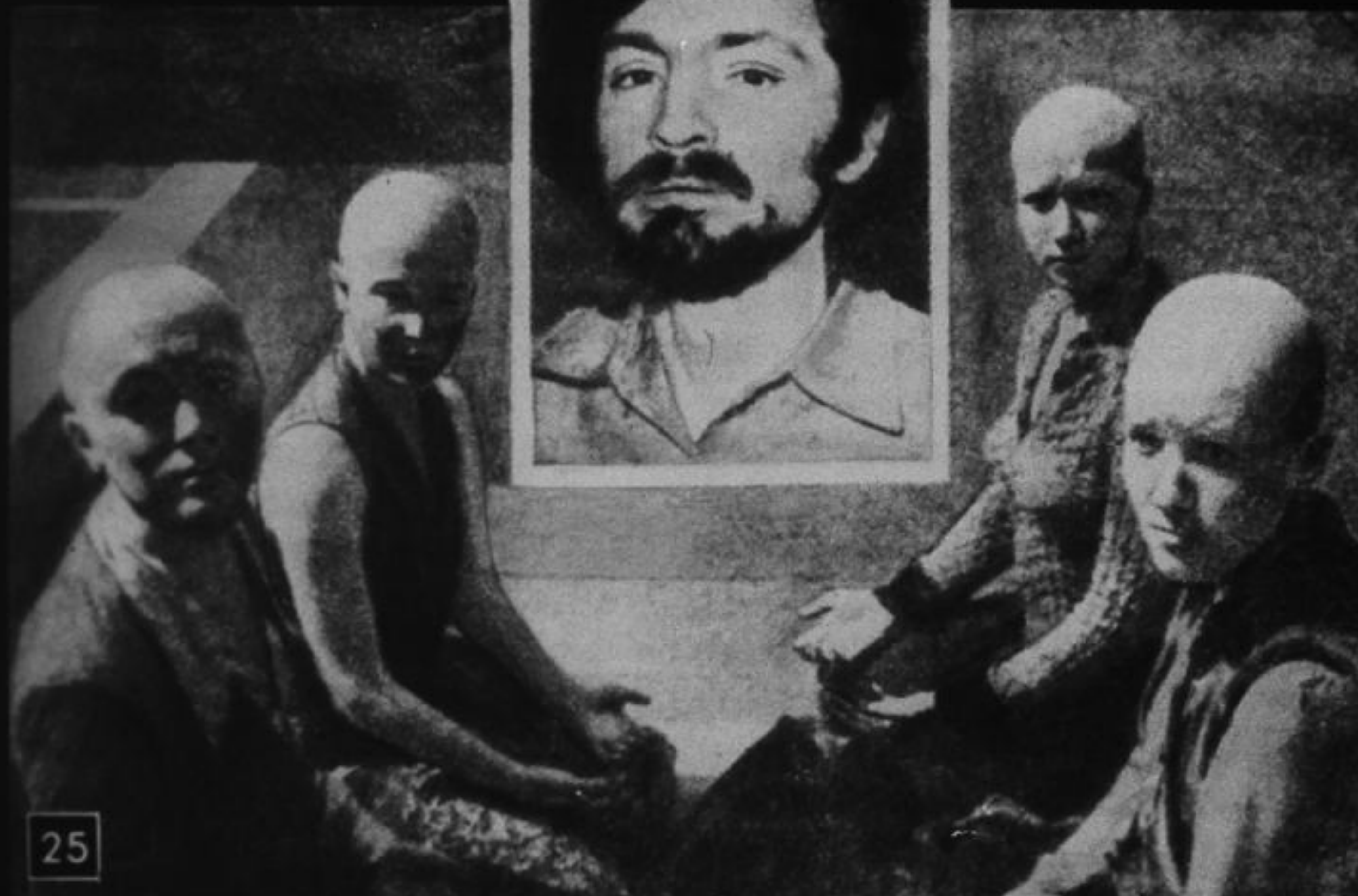
Сатанист Менсон со своим «семейством».