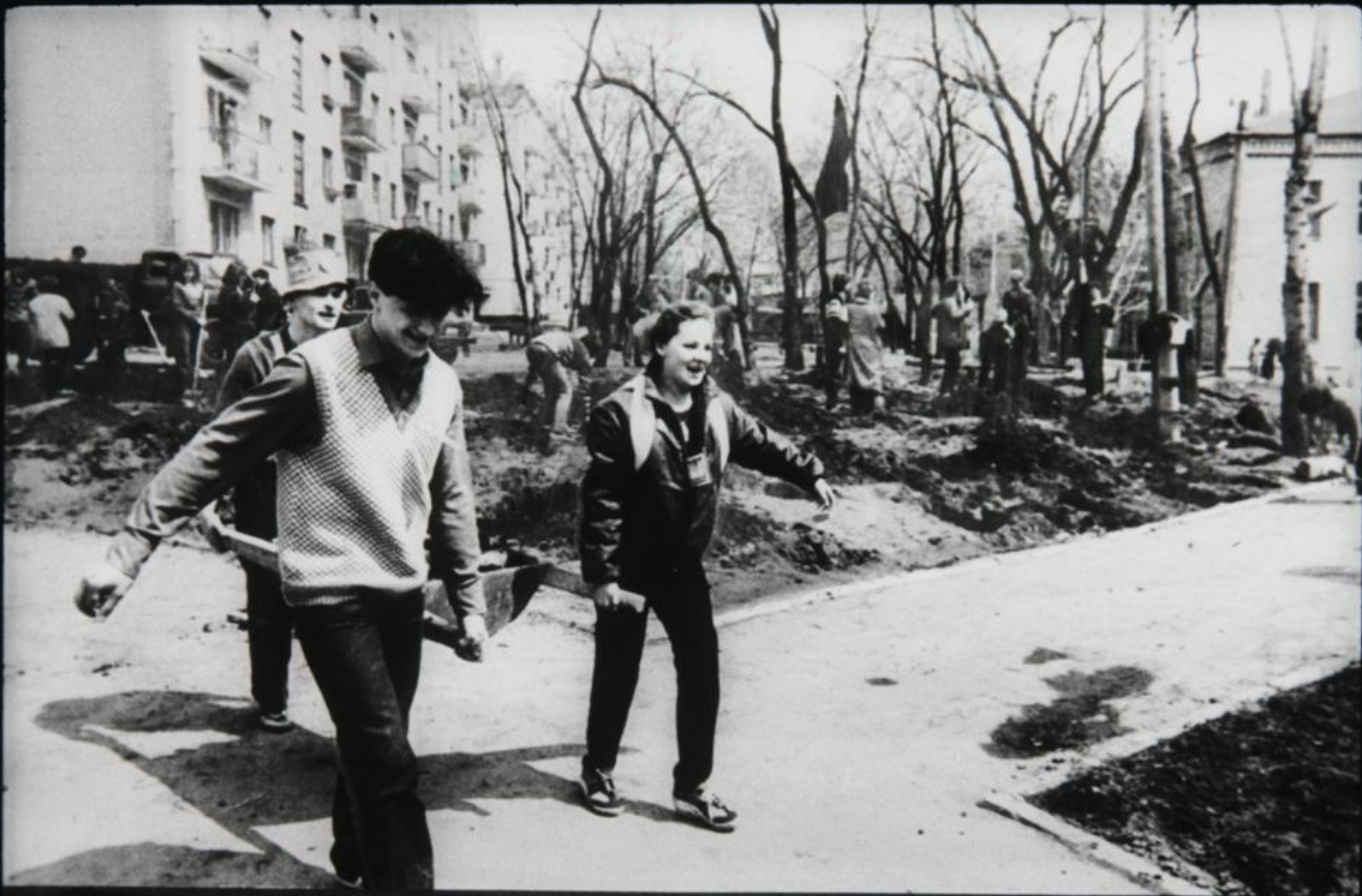
Много желающих было посадить свое деревце в сквере Советско-афганской дружбы.