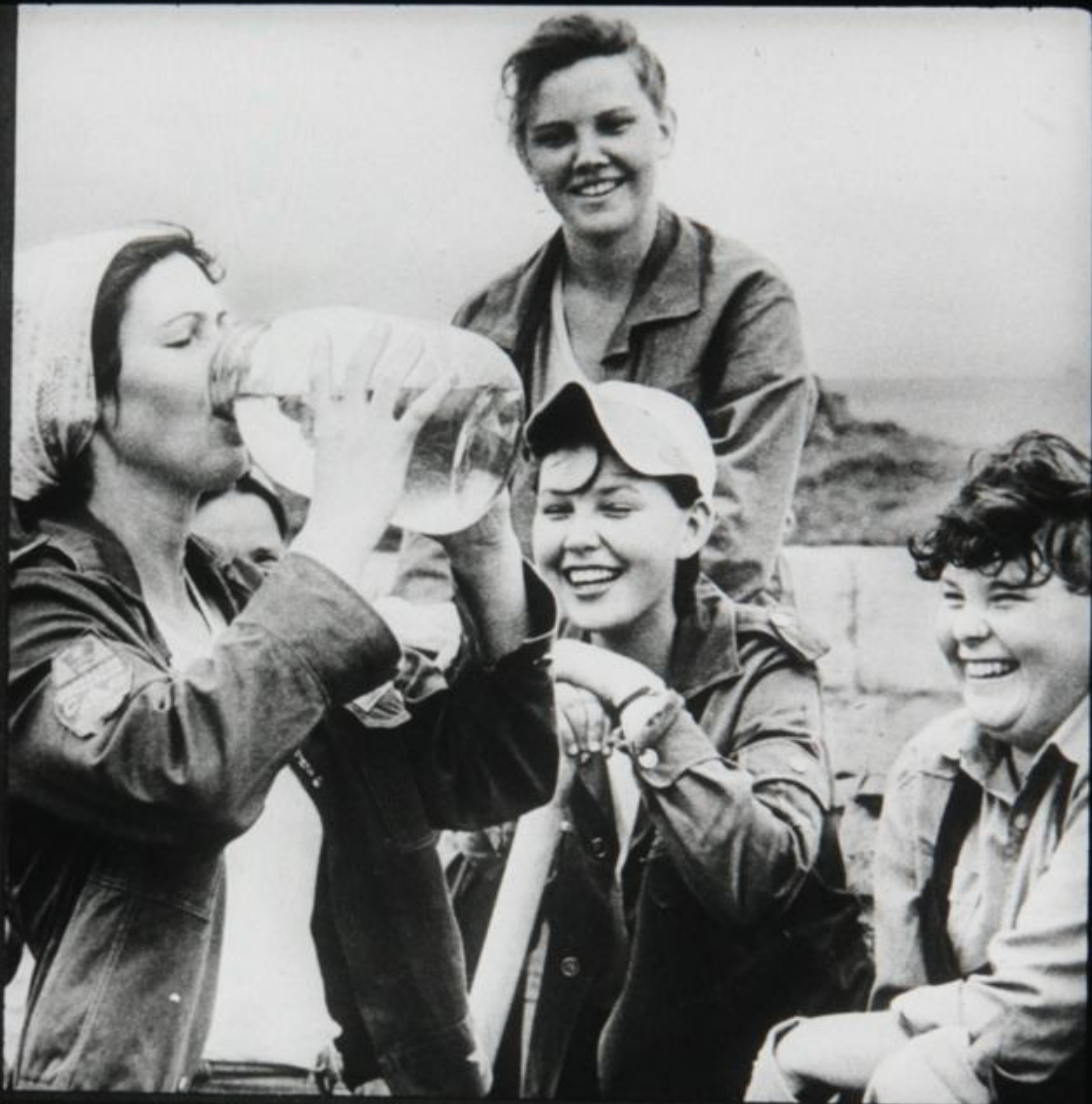
Члены ССО Марийского государственного педагогического института в минуты отдыха.

Растет экономический эффект и от деятельности студенческих строительных отрядов. За 25 лет объем выполненных ими работ увеличился почти в тысячу раз.